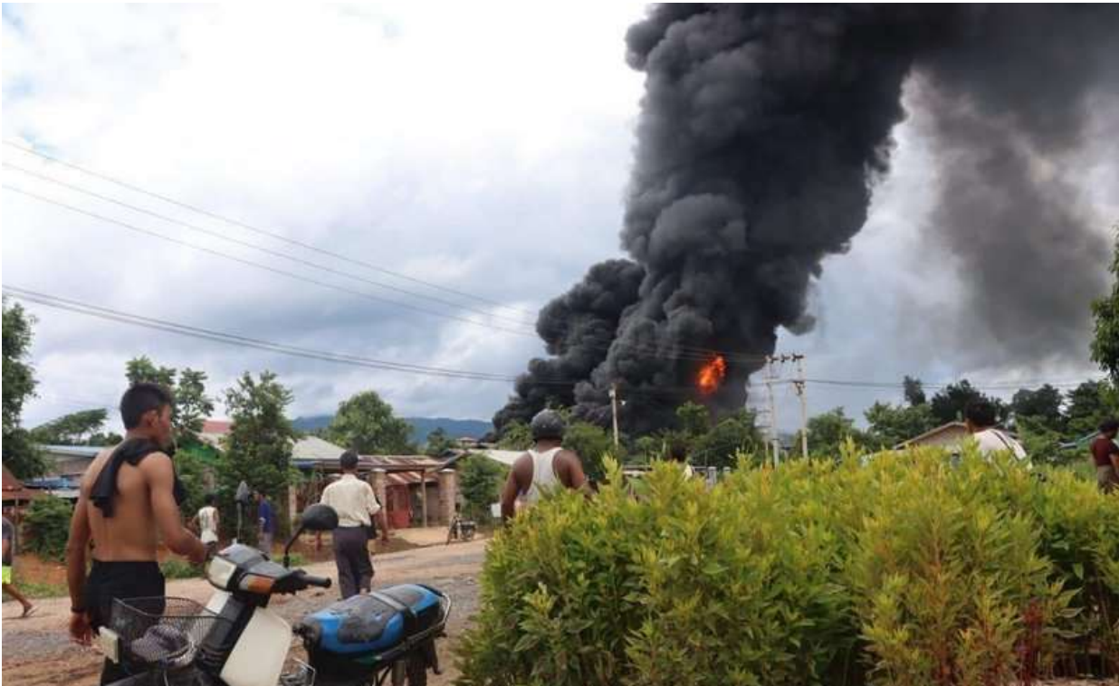
တရုတ်ရေနံနှင့်သဘာဝဓာတ်ငွေ့ပိုက်လိုင်းအနီးရှိ ကျောင်းစုကျေးရွာရှိ ဆီကန်ကိုစစ်ကောင်စီမှလေကြောင်းတိုက်ခိုက်မှု

ဩဂုတ်လ ၁၁ ရက်နေ့တွင် စစ်ကောင်စီတပ်သည်သီပေါမြို့ကို လေကြောင်းမှစတင်တိုက်ခိုက်ခဲ့ရာ မြို့လယ် ကောင် ရှိ မြို့လယ်ရွှေစေတီဘုန်းကြီးကျောင်းပုံးကြံခံခဲ့ရပြီး သံဃာတစ်ပါး၊ သီလရှင်တစ်ပါးနှင့် အခြား အမျိုးသမီး တစ်ဦး ဒဏ်ရာရခဲ့သည်။မြို့အရှေ့မြောက်ဘက်ရှိတာပုတ်ကျေးရွာပုံးကြံခံရမှုတွင် အမျိုးသားတစ်ဦး သေဆုံးခဲ့ပြီး အခြား အရပ်သား ၂ ဦးဒဏ်ရာရခဲ့သည်။