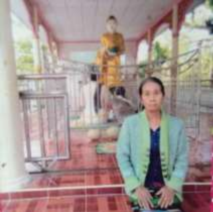
စစ်ကောင်စီလေကြောင်းတိုက်ခိုက်မှုကြောင့် သေဆုံးသူပါအောင်

ဩဂုတ် လ ၂၂ ရက်တွင် MNDA တပ်ဖွဲ့ သည် ခလရ ၁၄၇ တပ်စ ခန်းကိုသိမ်းပိုက် နိုင်ခဲ့သည်။