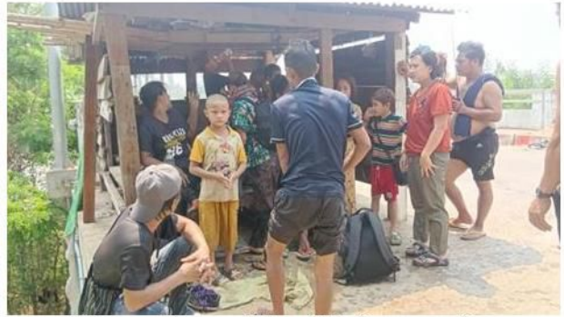
ဖားဆောင်းမြို့၊ စကစထိန်းထံမှ ထွက်ပြေးလွတ်မြောက်လာသော အရပ်သားများ

ဧပြီ ၂၉ ရက်၊ ဖားဆောင်းမြို့တွင် စစ်ကောင်စီတပ်များ၏ ဓားစာခံအဖြစ် ဖမ်းဆီးထိန်းသိမ်းခံရသော အရပ်သား ၁၈ ဦး ထွက်ပြေးလွတ်မြောက်လာခဲ့သည်။ ထိုထွက်ပြေးလွတ်မြောက်လာသော မြို့ခံအရပ်သားများတွင် ကိုယ်ဝန်သည်အမျိုးသမီးများအပြင် ကလေးငယ်များလည်း ပါဝင်သည်။