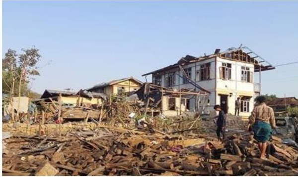
စကစမှ ကုန်းသာကျေးရွာအား လေကြောင်းဖြင့် ဗုံးကြဲ၊ လှိုင်ကော်မြို့နယ်