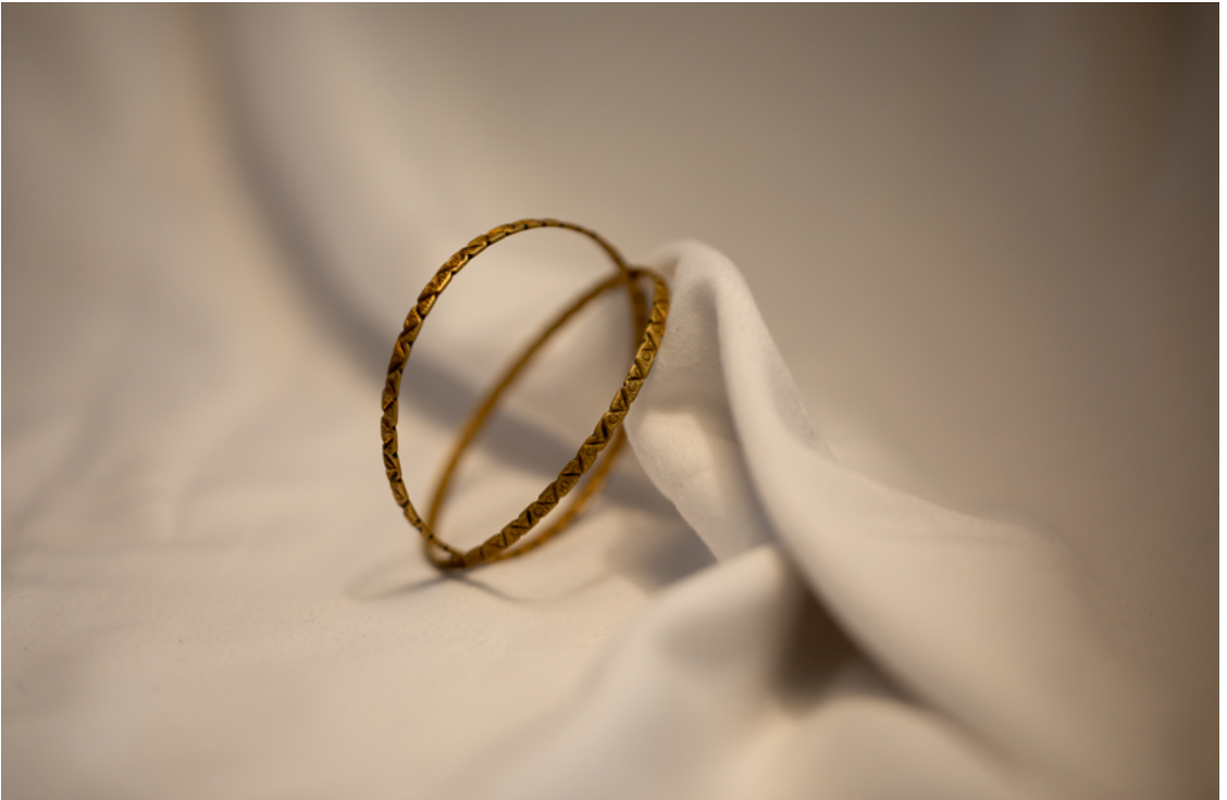
“ဒါတွေက ရွှေတွေမဟုတ်ဘူး၊ တန်ဖိုးကြီးပစ္စည်း မဟုတ်ဘူးဆိုတာ ကျွန်မ သိတယ်။ ဒါပေမယ့် ကျွန်မရဲ့ရွာကို မြန်မာစစ်တပ်က တိုက်ခိုက်ပြီး မီးရှို့ခဲ့ပြီးတဲ့ နောက်မှာတော့ အဝတ်အစား ကလွဲလို့ ဒါတွေက ကျွန်မ သယ်သွားလို့ရတဲ့ ရှေးဟောင်းပစ္စည်းတွေပဲ။ ဒါတွေက ကျွန်မအတွက်တော့ အမှတ်တရပါပဲ။ ကျွန်မရဲ့ယောက်ျားက ကျွန်မအတွက် ဝယ်ထားပေးတာပါ။ ဒါကြောင့် ဒါတွေကို လုံခြုံအောင် ထိန်းထားမယ်။” - ဘင်္ဂလားဒေ့ရှ်နိုင်ငံတွင် နေထိုင်နေသော အသက် ၃၂ နှစ် အရွယ် ရိုဟင်ဂျာ ဒုက္ခသည် အမျိုးသမီးတစ်ဦး။ ©Saiful Huq Omi, Counter Foto, ဘင်္ဂလားဒေ့ရှ်နိုင်ငံ၊ ၂၀၂၃ ခုနှစ်။