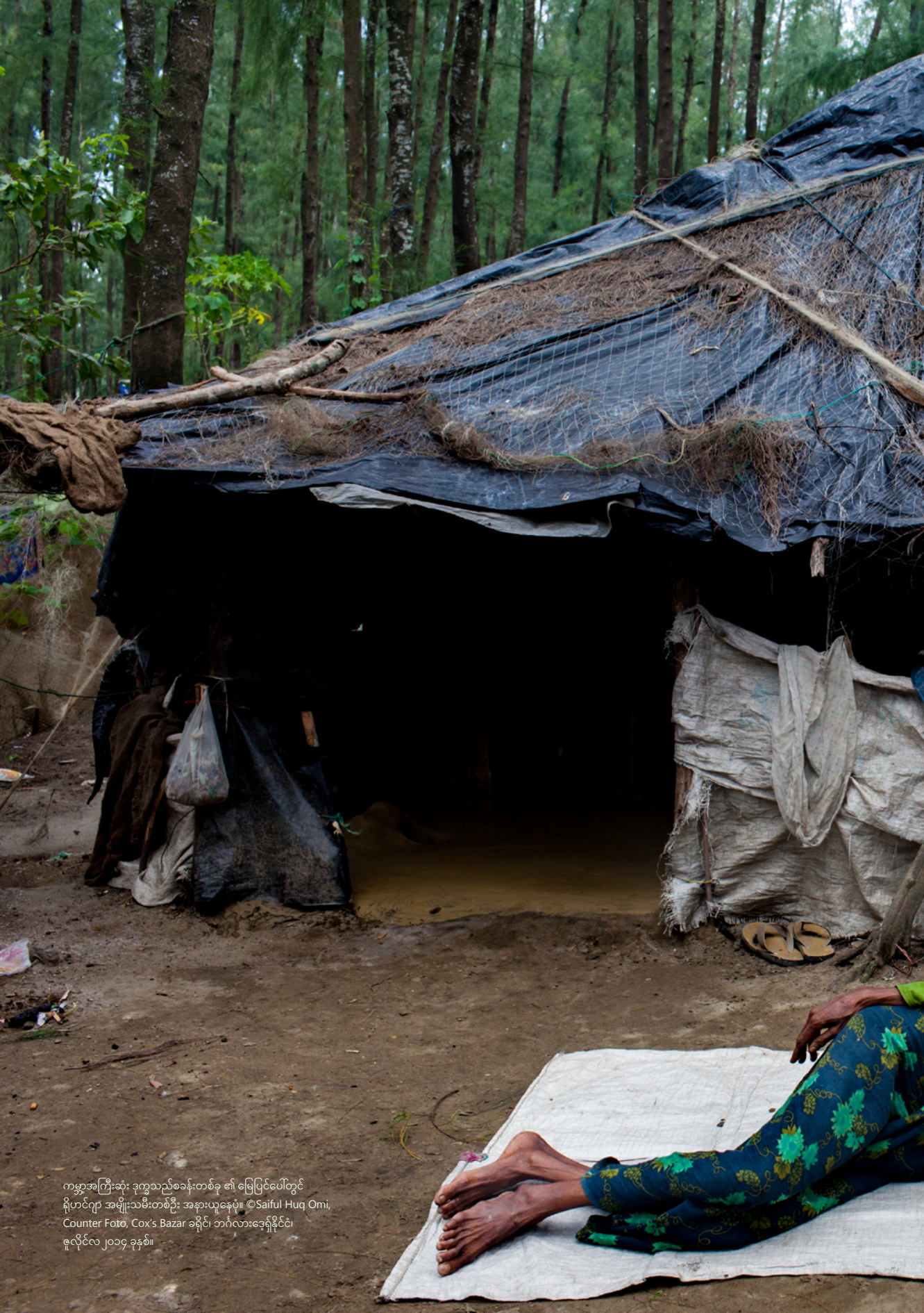
ကမ္ဘာ့အကြီးဆုံး ဒုက္ခသည်စခန်းတစ်ခု ၏ မြေပြင်ပေါ်တွင် ရိုဟင်ဂျာ အမျိုးသမီးတစ်ဦး အနားယူနေပုံ။ Cox's Bazar ခရိုင်၊ ဘင်္ဂလားဒေ့ရှ်နိုင်ငံ၊ ဇူလိုင်လ ၂၀၁၄ ခုနှစ်။