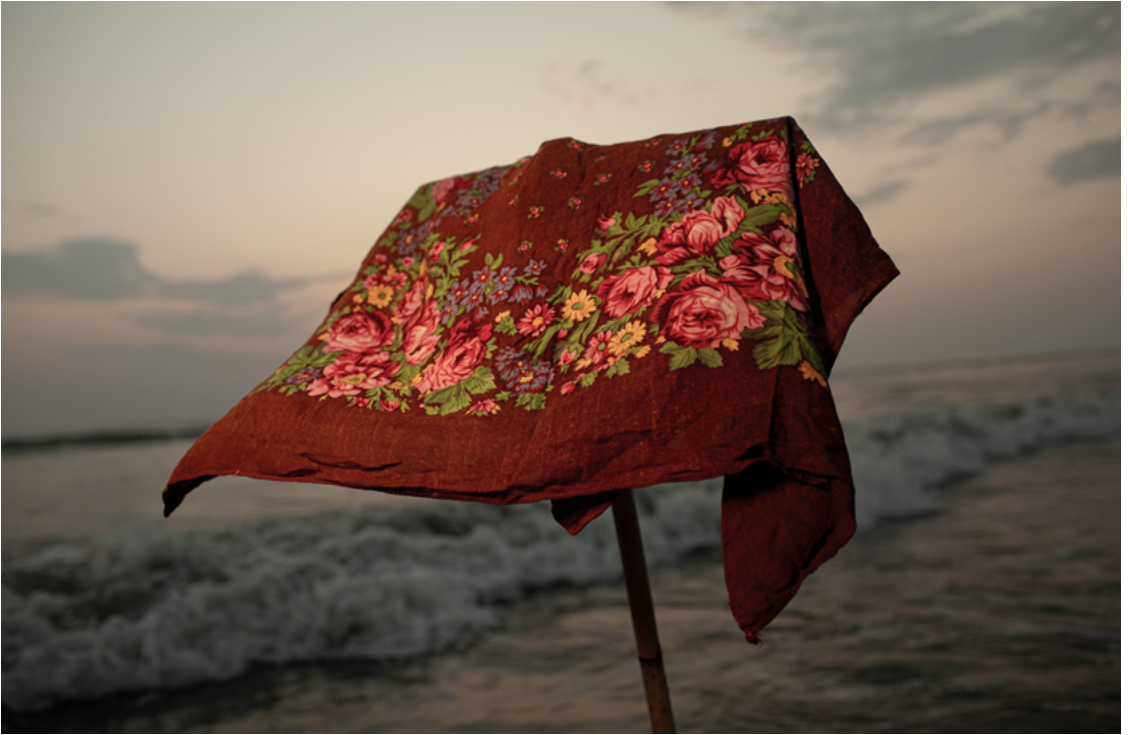
“ဒီပုဝါကို ကျွန်မကိုယ်တိုင် ချုပ်ထားတာ။ ၂၀၁၈ ခုနှစ် မှာ ဘင်္ဂလားဒေ့ရှ်နိုင်ငံကို ရောက်လာတုန်းက ယူလာတာ။ ဒါ ကျွန်မရဲ့ အကြိုက်ဆုံးပုဝါပဲလေ။ စစ်အာဏာရှင်တွေက ကျွန်မတို့ရွာကို လာပြီး ကျွန်မရဲ့ အိမ်အပါအဝင် တစ်ရွာလုံး၊ တစ်မြို့လုံး၊ အကုန်လုံးကို မီးရှို့ခဲ့ကြတယ်။ တစ်ခါတလေ ဟိဂျတ် (ပုဝါ) ဝတ်ရတဲ့အခါ ကိုယ်အမိမြေကိုယ်သတိရမိပါတယ်” - ရသေ့တောင် မြို့နယ်မှ အသက် ၄၅ နှစ်အရွယ် ရိုဟင်ဂျာ ဒုက္ခသည် အမျိုးသမီးတစ်ဦး။ ဘင်္ဂလားဒေ့ရှ်နိုင်ငံ၊ ၂၀၂၃ ခုနှစ်။