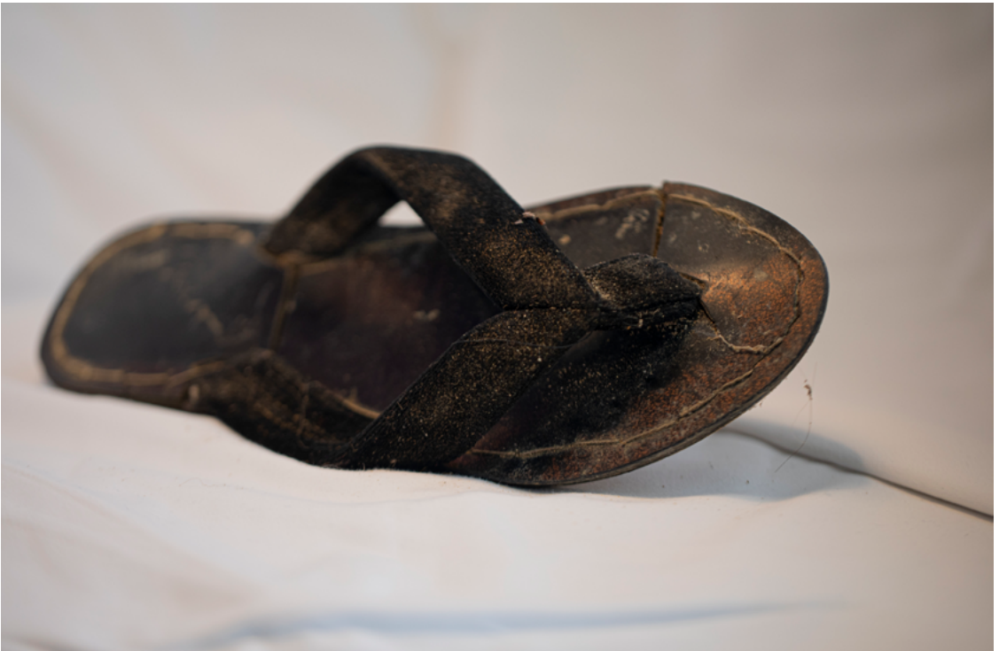
“ဘင်္ဂလားဒေ့ရှ်နိုင်ငံကို ရောက်ဖို့ ဘယ်လောက်ဝေးဝေး လမ်းလျှောက်ခဲ့ရတယ်ဆိုတာ မမှတ်မိတော့ဘူး။ နွေရောင်ပါ လျှောက်ခဲ့ရတာလေ။ ကျွန်မမှာ ဒီခြေညှပ်ဖိနပ်တစ်ရုံ ရှိသေးတယ်။ ဘင်္ဂလားဒေ့ရှ်ဘက်ကို ထွက်လာတုန်းကလည်း ဒါတွေပဲ ဝတ်ထားခဲ့တာ။ ဒီရောက်တော့ ပျက်စီးပြီး ဝတ်လို့မရတော့တဲ့အတွက် ပြန်ပြင်ခဲ့ရတာတွေ ရှိတယ်။ ဒါပေမယ့် မပစ်ချင်ဘူး။ သိမ်းထားချင်တယ်။ ဒါလေးတွေက မြန်မာနိုင်ငံကပါ။” - မြန်မာနိုင်ငံ ရခိုင်ပြည်နယ်မှ အသက် ၂၄ နှစ်အရွယ် ရိုဟင်ဂျာ ဒုက္ခသည် အမျိုးသမီးတစ်ဦး။ ©Saiful Huq Omi Counter Foto၊ ဘင်္ဂလားဒေ့ရှ်နိုင်ငံ၊ ၂၀၂၃ ခုနှစ်။