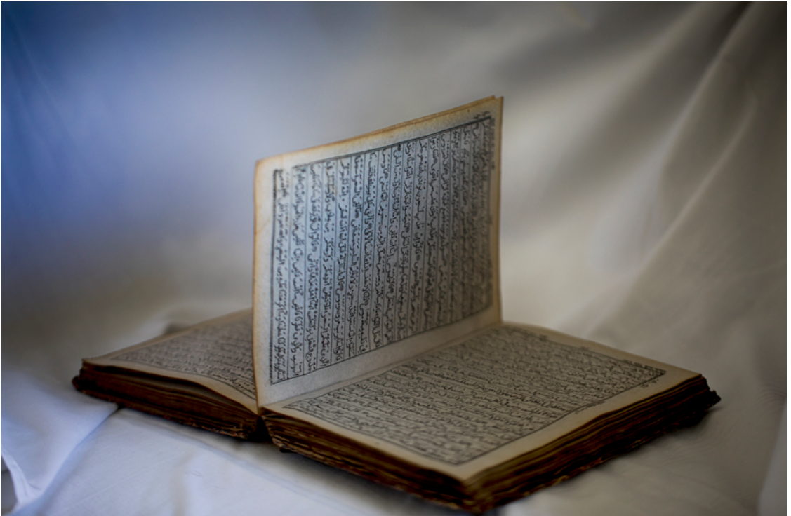
“ကျွန်တော်တို့ရွာ တိုက်ခိုက်ခံရလို့ ထွက်ပြေးရတဲ့ အချိန်မှာ သေချာထုပ်ပိုးဖို့က အချိန်မရှိတော့ဘူး။ ဒါပေမယ့် ကျွန်တော်ကလည်း ကျမ်းမြတ်ကုရ်အာန်ကို ဘယ်သောအခါမှ ထားခဲ့မှာ မဟုတ်ပါဘူး။ ကျွန်တော်က ဗွတ်စလင်တစ်ယောက် ဖြစ်တဲ့အတွက် ကျွန်တော့်ရဲ့ ဆုတောင်းပုတီးစေ့ (Tasbeeh) ကို အတူ သယ်ယူခဲ့ပါတယ်” - မြန်မာနိုင်ငံ၊ ရခိုင်ပြည်နယ်မှ အသက် ၆၀ အရွယ် ရိုဟင်ဂျာ ဒုက္ခသည် အမျိုးသားတစ်ဦး။ ©Saiful Huq Omi Counter Foto၊ ဘင်္ဂလားဒေ့ရှ်နိုင်ငံ၊ ၂၀၂၃ ခုနှစ်။ 3