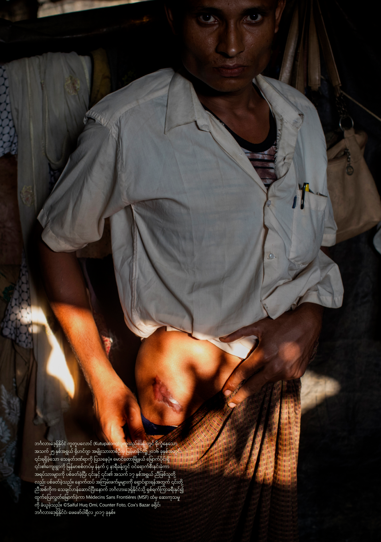
ဘင်္ဂလားဒေ့ရှ်နိုင်ငံ ကူတူပလောင် (Kutupalong) ဒုက္ခသည်စခန်းတွင် ခိုလှုံနေသော အသက် ၂၅ နှစ်အရွယ် ရိုဟင်ဂျာ အမျိုးသားတစ်ဦးမှ မြန်မာနိုင်ငံ၌ ၂၀၁၆ ခုနှစ်အတွင်း ၎င်းရရှိခဲ့သော သေနတ်ဒဏ်ရာကို ပြသနေပုံ။ မောင်တောမြို့နယ် မြောက်ပိုင်းရှိ ၎င်း၏ကျေးရွာကို မြန်မာစစ်တပ်မှ နှံ့နက် ၄ နာရီခန့်တွင် ဝင်ရောက်စီးနင်းခဲ့ကာ အရပ်သားများကို ပစ်ခတ်ခဲ့ပြီး ၎င်းနှင့် ၎င်း၏ အသက် ၁၇ နှစ်အရွယ် ညီဖြစ်သူတို့ လည်း ပစ်ခတ်ခဲ့သည်။ နောက်ထပ် အကြမ်းဖက်မှုများကို ရှောင်ရှားရန်အတွက် ၎င်းတို့ ညီအစ်ကိုက သေချင်ဟန်ဆောင်ပြီးနောက် ဘင်္ဂလားဒေ့ရှ်နိုင်ငံသို့ ရှစ်ရက်ကြာခရီးနှင့်၍ ထွက်ပြေးလွတ်မြောက်ခဲ့ကာ Médecins Sans Frontières (MSF) ထံမှ ဆေးကုသမှု ကို ခံယူခဲ့သည်။ Cox's Bazar ခရိုင်၊ ဘင်္ဂလားဒေ့ရှ်နိုင်ငံ၊ ဖေဖော်ဝါရီလ ၂၀၁၇ ခုနှစ်။