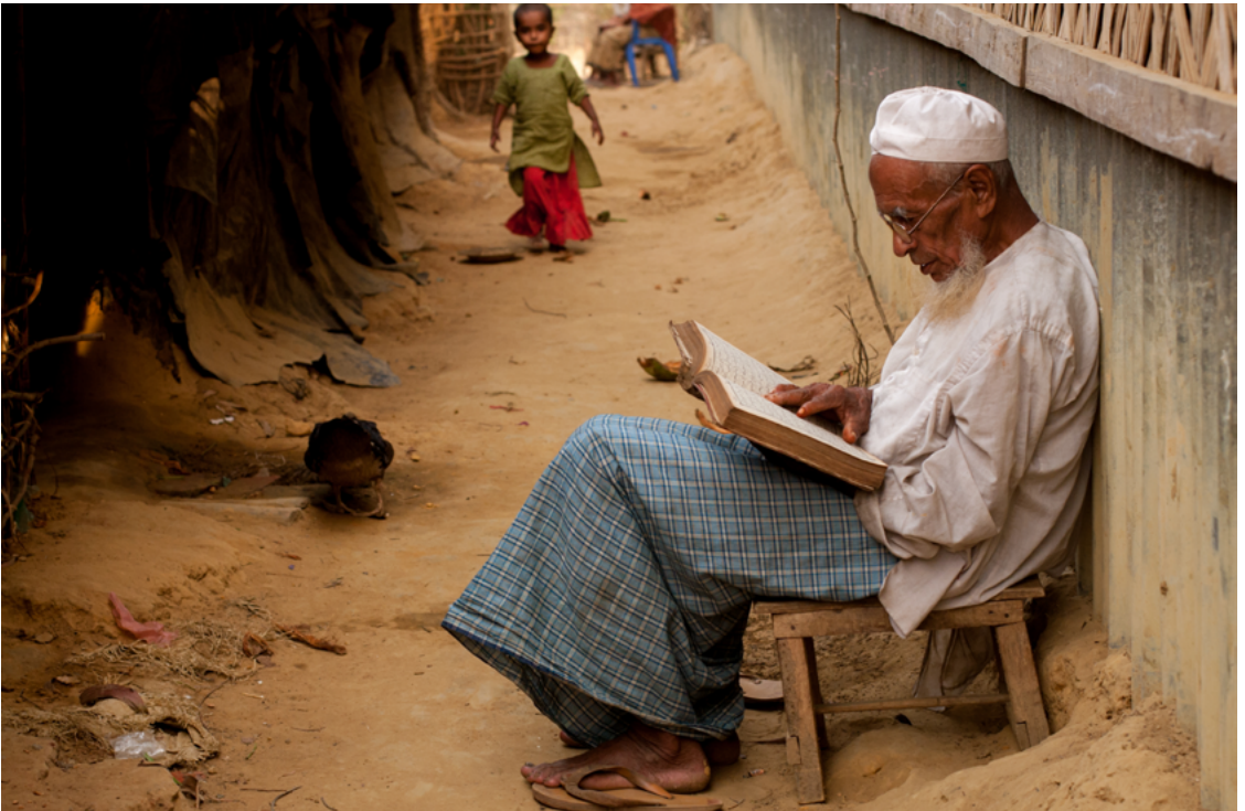
မြန်မာနိုင်ငံမှ ရိုဟင်ဂျာ အမျိုးသားတစ်ဦး ဘင်္ဂလားဒေ့ရှ်နိုင်ငံ ဒုက္ခသည်စခန်းတွင် ကျမ်းမြတ်ကုရ်အာန်ကို ဖတ်နေပုံ။ Fortify Rights မှ ပံ့ပိုးကူညီထားသည့်အဖွဲ့မှ စစ်တမ်း ကောက်ယူချက်များအရ ရိုဟင်ဂျာ ၉၄ ရာခိုင်နှုန်းကျော် သည် ၎င်းတို့အား မြန်မာအာဏာပိုင်များက ၎င်းတို့၏ဘာသာရေးကို ဆန့်ကျင်စေသည့် အရာများဖြစ်သည့် ဦးဆောင်းများဖယ်ရှားစေခြင်း၊ မုတ်ဆိတ်မွေးရိတ်စေခြင်း၊ ဝက်သားစားစေခြင်း စသည့် လုပ်ရပ်များအား အတင်းအဓမ္မ စေခိုင်းခဲ့ကြောင်း ဖော်ပြခဲ့ကြသည်။ Cox's Bazar ခရိုင်၊ ဘင်္ဂလားဒေ့ရှ်နိုင်ငံ၊ မတ်လ ၂၀၀၉ ခုနှစ်။