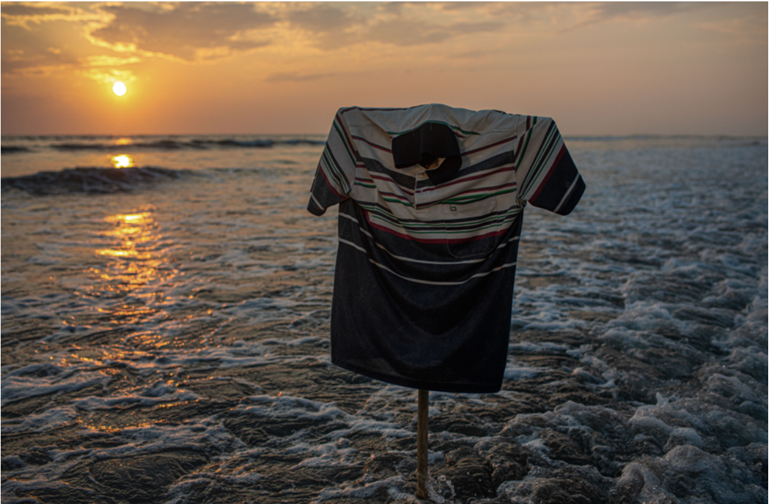
“ကျွန်တော် အမိမြေကို ပြန်ချင်တယ်။ သူတို့တွေက ကျွန်တော် တို့အပေါ်မှာ ရာဇဝတ်မှုတွေ အများကြီး ကျူးလွန်ခဲ့ကြတယ်။ ကျွန်တော်တို့ကို အရမ်းနှိပ်စက်ခဲ့တယ်။ ဘင်္ဂလားဒေ့ရှ်နိုင်ငံကို ရက်တွေ အကြာကြီး လမ်းလျှောက်ပြီး ထွက်ပြေးလာခဲ့ရတယ်။ ကျွန်တော် လာတုန်းကလည်း ဒီအင်္ကျီကို ဝတ်ပြီးလာခဲ့တယ်။ ဒါကိုလည်း အခုထိ ပုံမှန်ဝတ်နေတုန်းပဲ။ ဒုက္ခသည်စခန်းမှာ မနေချင်ဘူး။ မြန်မာနိုင်ငံကို ပြန်ချင်တယ်” - ဘင်္ဂလားဒေ့ရှ်နိုင်ငံတွင် နေထိုင်နေသော လူမျိုးတုံးသတ်ဖြတ်မှုမှ အသက်ရှင်ကျန်ရစ်သူ ရိုဟင်ဂျာတစ်ဦး။ ©Saiful Huq Omi, Counter Foto, ဘင်္ဂလားဒေ့ရှ်နိုင်ငံ၊ ၂၀၂၃ ခုနှစ်။