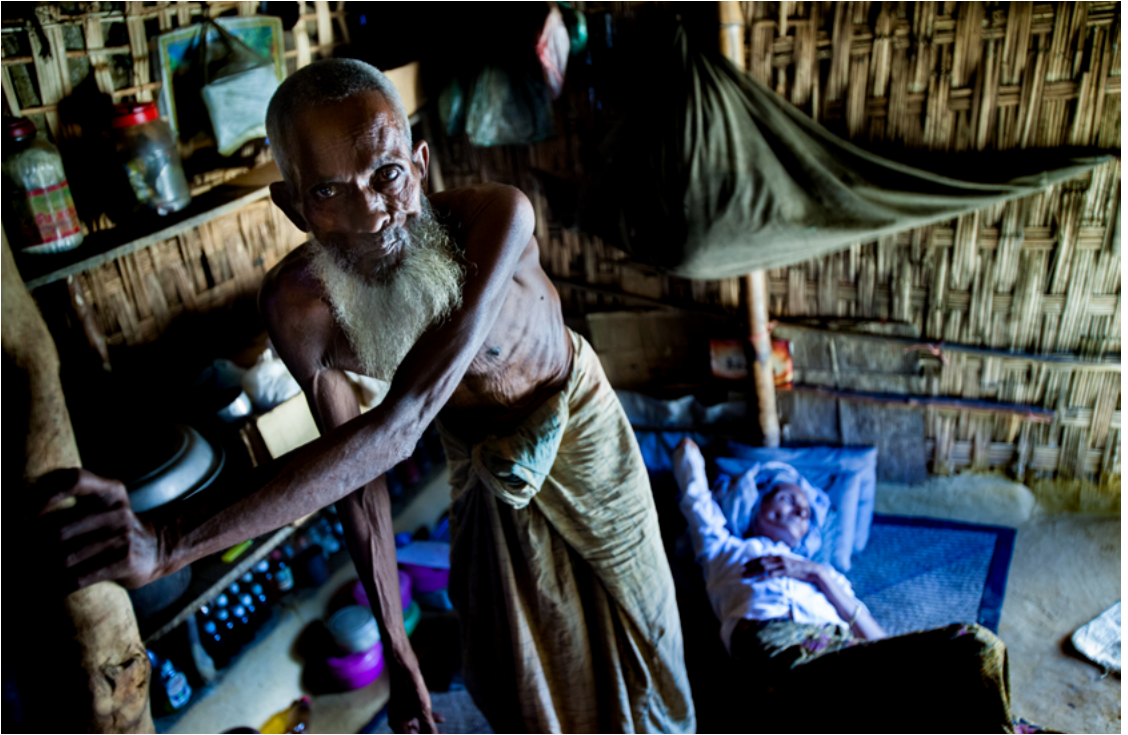
သက်ကြီးရွယ်အို ရိုဟင်ဂျာ ဒုက္ခသည်တစ်ဦးနှင့် ၎င်း၏ ဇနီး။ ၎င်းတို့ နှစ်ဦးစလုံးမှာ လူမျိုးတုံးသတ်ဖြတ်မှုမှ လွတ်မြောက်ခဲ့သူများဖြစ်ပြီး ၎င်းတို့အား ဘင်္ဂလားဒေ့ရှ်နိုင်ငံ ဒုက္ခသည်စခန်းတွင် တွေ့ရစဉ်။ ©Saiful Huq Omi, Counter Foto, Cox's Bazar ခရိုင်၊ ဘင်္ဂလားဒေ့ရှ်နိုင်ငံ၊ ဇူလိုင်လ ၂၀၁၀ ခုနှစ်။