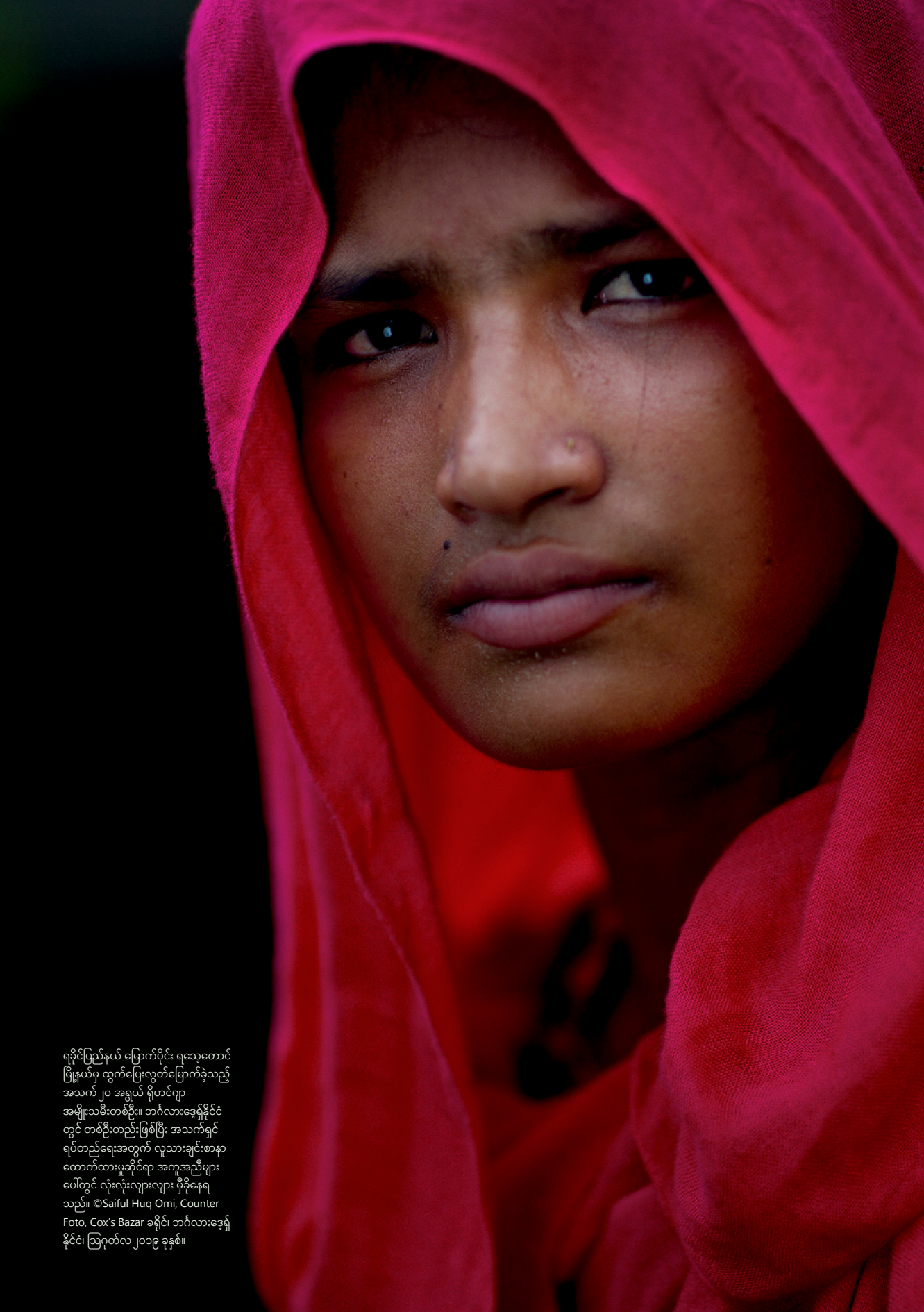
ရခိုင်ပြည်နယ် မြောက်ပိုင်း ရသေ့တောင် မြို့နယ်မှ ထွက်ပြေးလွတ်မြောက်ခဲ့သည့် အသက် ၂၀ အရွယ် ရိုဟင်ဂျာ အမျိုးသမီးတစ်ဦး။ ဘင်္ဂလားဒေ့ရှ်နိုင်ငံ တွင် တစ်ဦးတည်းဖြစ်ပြီး အသက်ရှင် ရပ်တည်ရေးအတွက် လူသားချင်းစာနာ ထောက်ထားမှုဆိုင်ရာ အကူအညီများ ပေါ်တွင် လုံးလုံးလျားလျား မှီခိုနေရ သည်။ Cox's Bazar ခရိုင်၊ ဘင်္ဂလားဒေ့ရှ် နိုင်ငံ၊ ဩဂုတ်လ ၂၀၁၉ ခုနှစ်။