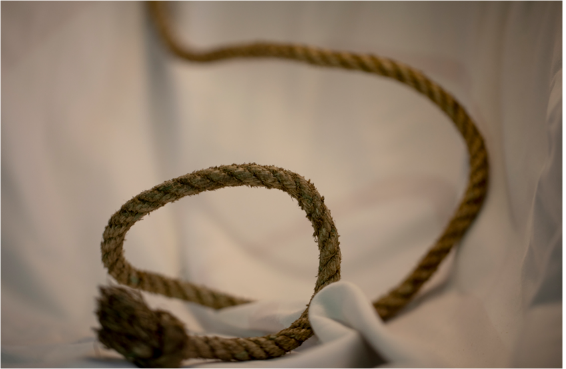
“မြန်မာနိုင်ငံက ကျွန်တော်အိမ်ကနေ သယ်နိုင်သမျှကို ဒီကြိုးနဲ့ချည်ပြီး သယ်ခဲ့တာပါ။ နိုင်ငံထဲကနေ မထွက်ခွာခင်သူ အများကြီးရှိမှန်းကိုလည်း ကျွန်တော်သိပါတယ်။ သူတို့ ဘာဆက်ဖြစ် သွားလဲတော့ ကျွန်တော်လည်း မသိတော့ဘူး။ မြန်မာစစ်တပ် က ရိုဟင်ဂျာ တော်တော်များများကို သတ်ခဲ့တာကို သိပါတယ်။ ဒီကြိုးက ကျွန်တော်နိုင်ငံကို သတိရစေပြီး ကျွန်တော်ရဲ့ ကံကြမ္မာကို ဒီကြိုးနဲ့ ချည်နှောင်ထားပါတယ်။ မြန်မာနိုင်ငံမှာ နေထိုင်ခဲ့ရတဲ့ ကျွန်တော်ရဲ့ နေ့ရက်တွေကို အမှတ်ရစေမယ့် ဒီကြိုးကို ဒီမှာ သိမ်းဆည်းထားပါတယ်” - မြန်မာနိုင်ငံ ရခိုင်ပြည်နယ်မှ ရိုဟင်ဂျာ ဒုက္ခသည် အမျိုးသားတစ်ဦး။ ©Saiful Huq Omi, Counter Foto, ဘင်္ဂလားဒေ့ရှ်နိုင်ငံ၊ ၂၀၂၃ ခုနှစ်။