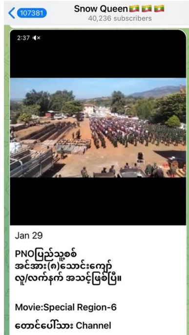
ပုံ (၁၀)။ ပြည်သူ့စစ် လှုပ်ရှားမှုများ။