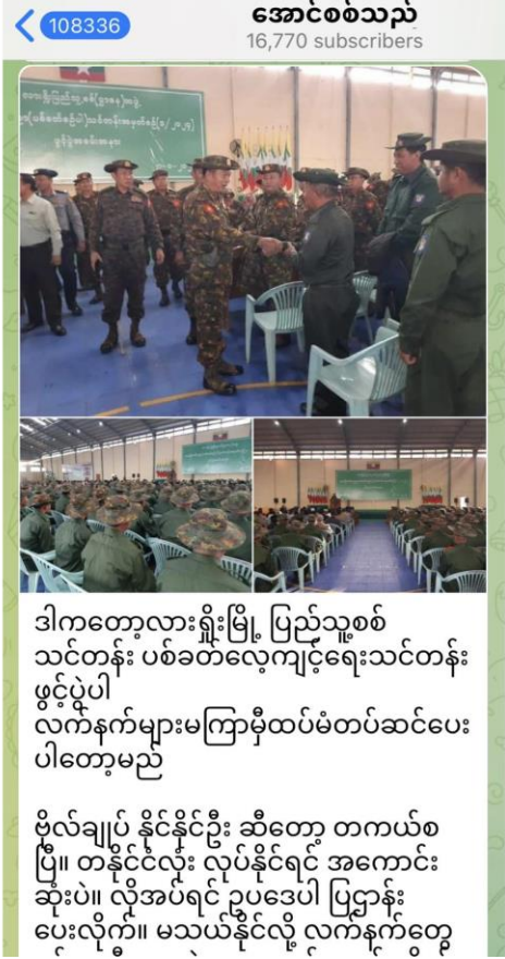
ပုံ (၁၂)။ ပြည်သူ့စစ် လှုပ်ရှားမှုများ။