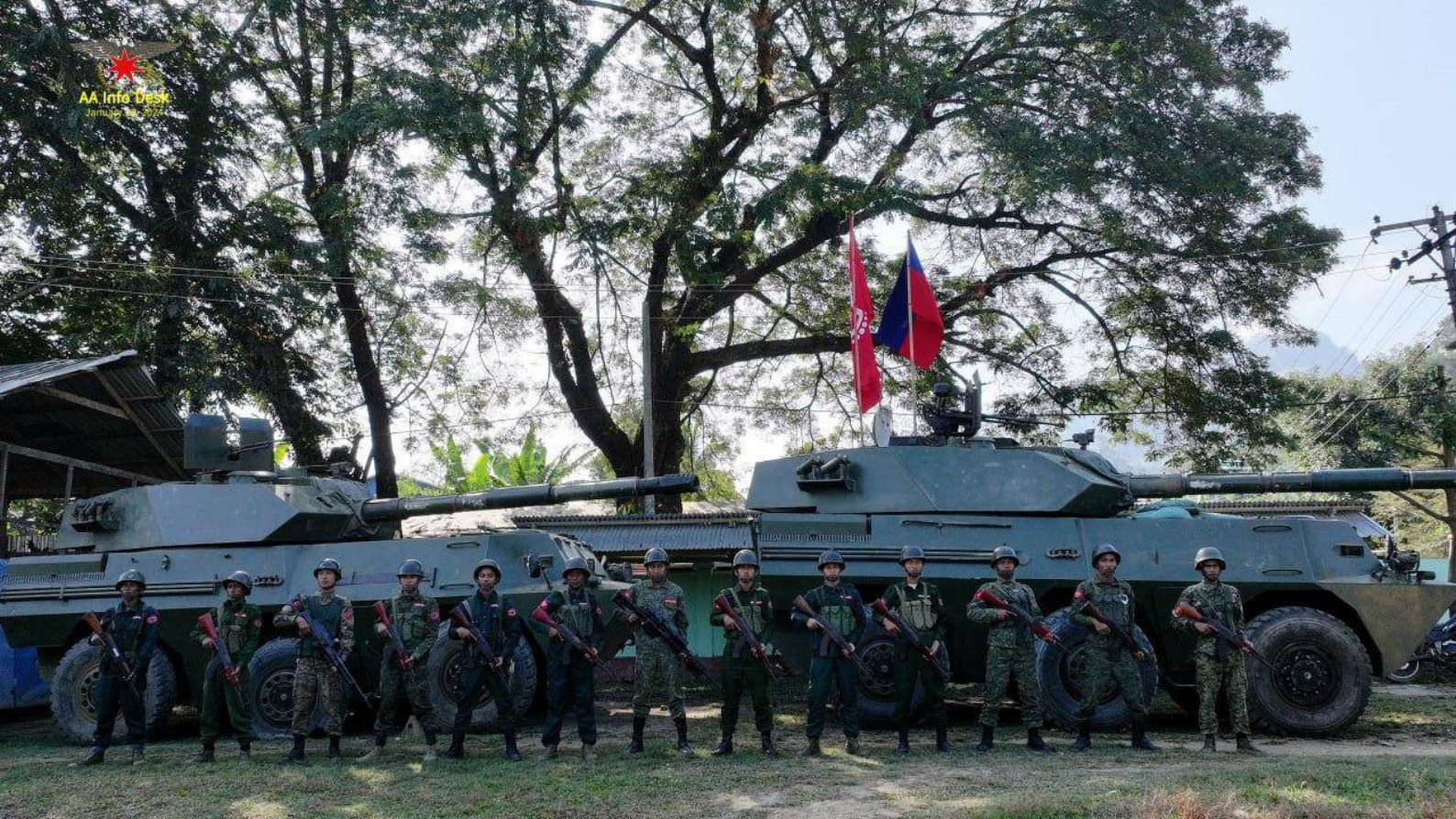
ပလက်ဝဒေသအခြေစိုက် စစ်ကောင်စီတပ်၏ ရှေ့တန်းတပ်မဌာနချုပ်ဖြစ်သော ခလရ (၂၈၉)၊ စကခ (၁၉) တိုအား ရက္ခိုင့်တပ်တော်မှ အပြီးသတ် သိမ်းပိုက်ပြီး မြင်ကွင်း