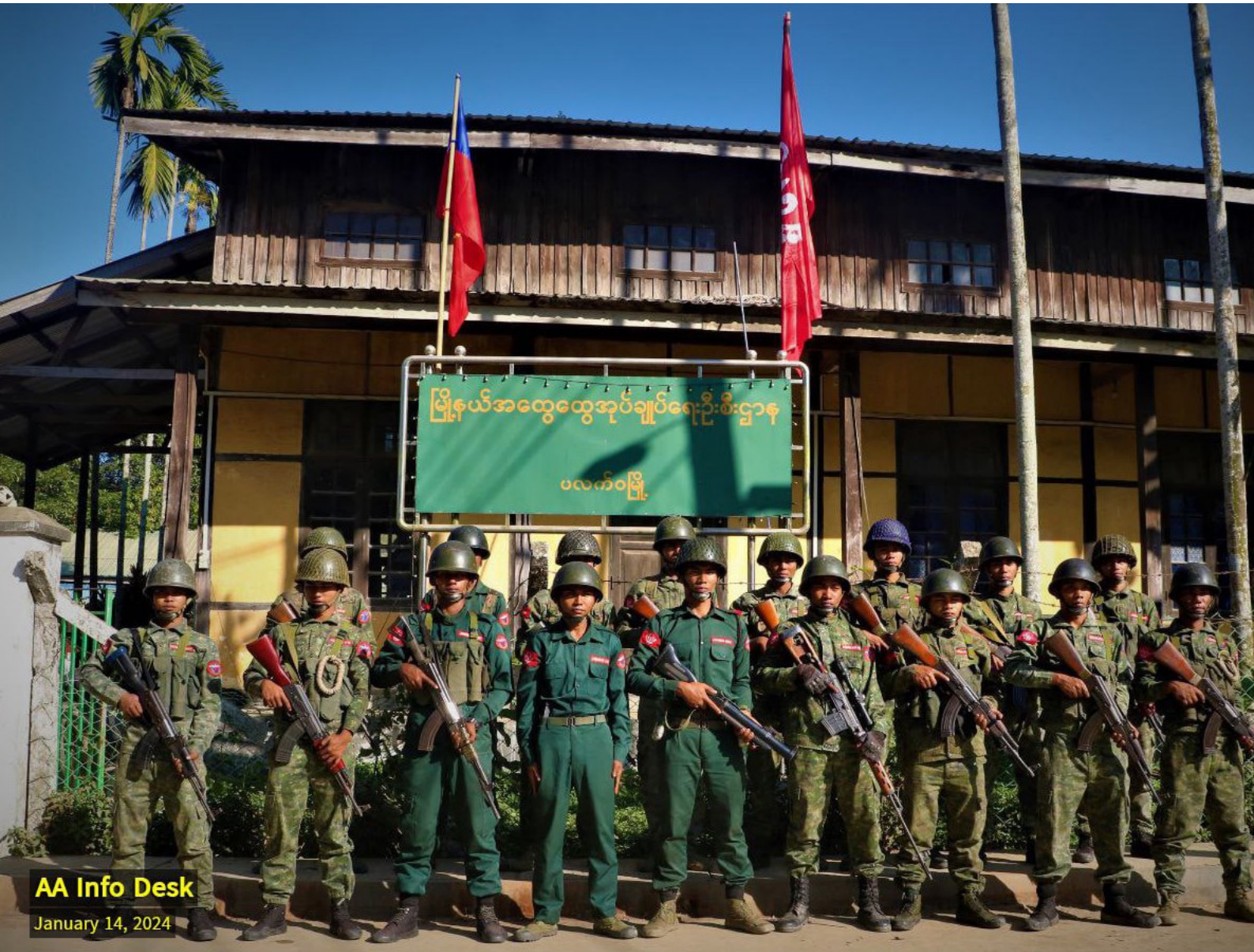
AA Info Desk January 14, 2024

ဟိုင်ဂင်သဘောတူညီချက်များနှင့် ရှမ်းမြောက်ဒေသ ယာယီအပစ်ရပ်ခြင်းသည် စစ်အာဏာရှင်စနစ်ချုပ်ငြိမ်းရေးနှင့် ဖက်ဒရယ်ဒီမိုကရေစီပြည်ထောင်စုတည်ဆောက်ရေးသို့ ဦးတည်လျှောက်လှမ်းလျက်ရှိသော နွေဦးတော်လှန်ရေးအပေါ် ကြီးမားသည့်သက်ရောက်မှုမျိုး မမြင်တွေ့ရသေးသည့်တိုင် မြန်မာ့နိုင်ငံရေး၊ စစ်ရေးနှင့် ငြိမ်းချမ်းရေးဆိုင်ရာ အတုံ့အလှည့်၊ အရွေ့အပြောင်းများတွင် ၎င်းတို့၏ ဩဇာညောင်းမှု၊ လွှမ်းမိုးနိုင်မှုတို့ကို ရုပ်လုံးထွက်ပြလာသည့် တရုတ်အစိုးရ၏ လှုပ်ရှားဆောင်ရွက်ချက်များကိုမူ သတိကြီးစွာဖြင့် စောင့်ကြည့်ရမည် ဖြစ်ကြောင်း သုံးသပ်တင်ပြအပ်ပါသည်။