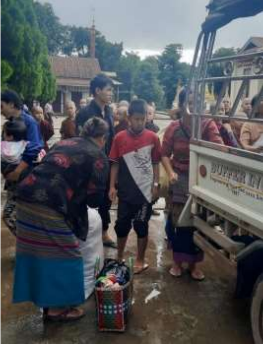
နမ္မဘုန်းကြီးကျောင်းသို့ထွက်ပြေးလာသောစစ်ရှောင်များ

နမ္မသို့ရောက်ရှိလာသောအဆိုပါစစ်ဘေးရှောင် များသည် တိုက်ပွဲများကို စိုးရိမ်မှုရှိသော်လည်း တစ်ပတ်အကြာ၊ နိုဝင်ဘာလ ၆ ရက်တွင် စပါးရိတ်သိမ်းရန် ၎င်းတို့၏အိမ်သို့ ပြန်ခဲ့ကြရသည်။