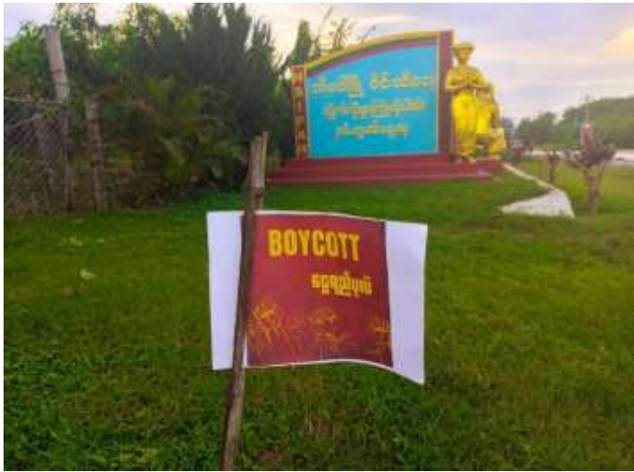
ငွေရည်ပုလဲကုမ္ပဏီအား သပိတ်မှောက်ရန်တိုက်တွန်းသည့် ပို့စတာ၊ ဩဂုတ်လ ၁၇က်၊ ၂၀၂၃ခုနှစ်