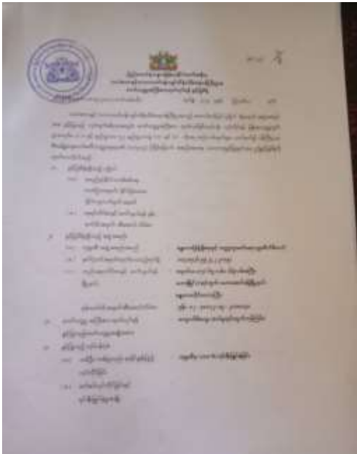
မန္တလေးမြို့ရှိချီရေးနှင့်သတ္တုတူးဖော်ရေးအား ကျောက်မီး သွေးတူးဖော်ခြင်းလုပ်ငန်းခွင့်ပြုမိန့်၊ ဩဂုတ်လ၊ ၂၀၂၃ ခုနှစ်