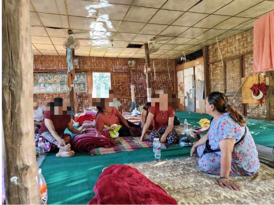
ဂူခင်းမိုင်းဟီးဗေးသိုက် ပိုင်းရှမ်းဝတ်.ဝုးခင်းပိုခင်းတီး