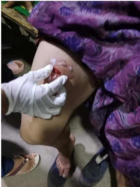
ခောင်းယိုင်းကခင်းလျှားလါဂ်,မာဂ်,လူင်သိုက်မာခင်းယိုဝ်း

မိုဝ်းဝမ်းထိ 17/9/2023 ခေခေ. သိုက်မာခင်းလေးသိုက်ပလွင်း; TNLA ပိခင်ပင်တိုက်ခေခေတီး; တင်းလါခင်း ဝါခင်းဝိုင်းခောင်း ကခမ်းမီးတင်းလိင်,လါခင်းဝိုင်းမူ,လေး။