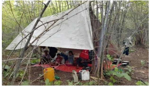
နန်းကစ်ကျေးရွာအား စကစမှ ဗုံးကြဲတိုက်ခိုက်၊ ဖားဆောင်းမြို့နယ်