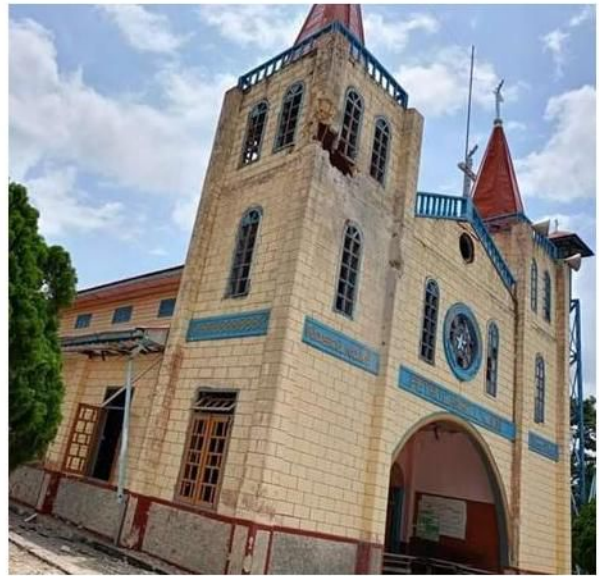
စကစ၏ လက်နက်ကြီးကြောင့် ပျက်စီးသွားသော ဘာသာရေးအဆောက်အဦး၊ မိုးမြ

ဇွန်လ ၁၀ ရက်၊ ဖယ်ခုံမြို့နယ်၊ ခေါင်းအိကျေးရွာတွင် ကရင်နီပူးပေါင်းတပ်များနှင့် စစ်ကောင်စီတပ်များ တိုက်ပွဲ ပြင်းထန်ခဲ့ပြီး တိုက်ပွဲအတွင်း ကရင်နီပူးပေါင်းတပ်များမှ ရဲဘော် ၂ ဦးကျဆုံးသွားခဲ့သည်။ ညနေ ၇ နာရီ အချိန်တွင် တိုက်ပွဲဖြစ်ပွားခြင်းမရှိဘဲ စစ်ကောင်စီတပ်မှ လက်နက်ကြီးများဖြင့် ဒီးမော့ဆို အနောက်ဘက်ခြမ်းသို့ ပစ်ခတ်ခဲ့သည့်အတွက် စစ်ဘေးရှောင်တစ်နေရာအတွင်းသို့ လက်နက်ကြီး ကျရောက်ပေါက်ကွဲကာ နေအိမ် တစ်လုံး ထိမှန်ပျက်စီးသွားခဲ့သည်။