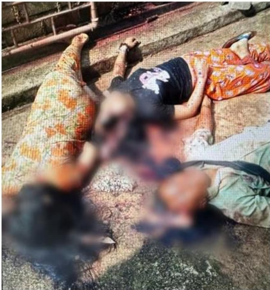
စကစတပ်များမှ အရပ်သားများ သတ်ဖြတ်ခြင်း၊ မိုးမြ

ထိမှန်ဒဏ်ရာရရှိသွားခဲ့သည့်အပြင် အိမ်ဆောက်ပစ္စည်းရောင်းသည့်ဆိုင်နှင့် ငွေသား သိန်း ၁၃၀ အပါအဝင် အခြားပစ္စည်းများ မီးလောင်ပျက်စီးသွားခဲ့သည်။