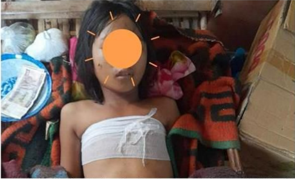
ဖယ်ခုံမြို့နယ်မှ ကယန်းပြည်သစ် လုံခြုံရေးဂိတ်အား စကစမှ ဗုံးကြဲတိုက် စကစ၏ လက်နက်ကြီးပစ်ခတ်မှုကြောင့် အမျိုးသမီးငယ်တစ်ဦး ထိခိုက်ဒဏ်ရာရှိ၊ လှိုင်ကော်မြို့နယ်

ဇွန်လ ၁ရက်၊ နံနက် ၄ နာရီအချိန်တွင် မိုးပြဲမြို့ အနောက်ဘက်ခြမ်းတွင် ထားရှိသော ကယန်းပြည်သစ် တပ်မတော်၏ လုံခြုံရေးဂိတ်တစ်နေရာအား စစ်ကောင်စီတပ်မှ လေယာဉ်ဖြင့် (၂)ကြိမ်ခန့် ဗုံးကြဲတိုက်ခိုက်ကာ ပျက်စီးသွားခဲ့သည့်အပြင် ဖယ်ခုံ-ပင်လောင်းနယ်စပ်မှ ခေါင်းအိ၊ ဖယ်ခုံ၊ စက်တော်ရာ၊ လွယ်လုံ၊ မြေနီကုန်း (၅) နေရာကို စစ်ကောင်စီတပ်မှ လေယာဉ် (၅)စီးဖြင့် ဗုံးကြဲတိုက်ခိုက်ခဲ့ပါသည်။