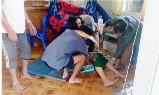
ဒီးမော့ဆိုအရှေ့ခြမ်းမှ လေကြောင်းဖြင့်တိုက်ခိုက်ခြင်း မိုးပြဲမှ စကစ၏ လက်နက်ကြီးထိမှန်ဒဏ်ရာရရှိသော အမျိုးသမီး

မေလ ၁၈ရက်၊ နံနက် ၃ နာရီခန့်တွင် ဒီးမော့ဆိုမြို့နယ်၊ ဒေါလောခူကျေးရွာနှင့် ဖဲလျားကျေးရွာတို့ကို စစ်ကောင်စီတပ်မှ ပေါင်အလေးချိန် ၅၀၀ ရှိသော ဗုံးဖြင့်တိုက်ခိုက်ခြင်းကြောင့် ဒေါလျားခူရွာမှ နေအိမ် (၅)လုံးနှင့် ဖဲလျားကျေးရွာမှ စာသင်ကျောင်းတစ်လုံး ထိခိုက်ပျက်စီးခဲ့ပါသည်။ ထိုတရက်တည်းအတွင်း နေ့လည် ၁၁ နာရီအချိန်တွင် ကား၁၀စီးပါသော စစ်ကောင်စီယာဉ်တန်းသည် မိုးပြဲမြို့နယ်အတွင်းဖြတ်သွားစဉ် လက်နက်ငယ် များဖြင့် ရမ်းသန်းပစ်ခတ်မှုကြောင့် ပြည်သူ ၃ ဦးထိခိုက်ဒဏ်ရာ ရရှိသွားသည်။ သည့်အပြင် နေ့လည် ၁၂ နာရီအချိန်ခန့်၌ မိုးပြဲတွင် စစ်ကောင်စီတပ်မှ ပစ်ခတ်လိုက်သည့် လက်နက်ကြီး တစ်လုံးကျရောက် ပေါက်ကွဲခဲ့ပြီး ခြံဝန်းအတွင်းတွင် ရှိနေသော အသက် ၄၁ နှစ်အရွယ်ရှိ အမျိုးသားတစ်ဦးအား ဘယ်ဘက် လက်မောင်း၊ လက်ပြင်၊ ခါးနှင့်ပေါင်တို့တွင် ထိခိုက်ဒဏ်ရာရရှိခဲ့ပါသည်။