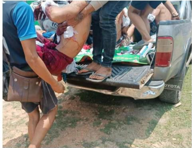
အရပ်သားများ လက်နက်ကြီးထိမှန်၊ ဖယ်ခုံမြို့နယ်

မေလ ၁ရက်နေ့၊ ဘောလခဲမြို့အတွင်း တပ်စွဲထားသည့် စစ်ကောင်စီတပ်ကို ဖားဆောင်းပြည်သူ့ကာကွယ်ရေးတပ်နှင့် ဘောလခဲပြည်သူ့ကာကွယ်ရေးတပ်မှ ဝင်ရောက်တိုက်ခိုက်ခဲ့ရာ စစ်ကောင်စီတပ်မှ (၇)ဦးသေဆုံးပြီး (၁၃)ဦးထက်မနည်း ထိခိုက်ဒဏ်ရာရရှိခဲ့ပါသည်။ တိုက်ပွဲအတွင်း ဘောလခဲပြည်သူ့ကာကွယ်ရေးတပ်မှ ရဲဘော် နှစ်ဦးလည်း ကျဆုံးခဲ့ပါသည်။