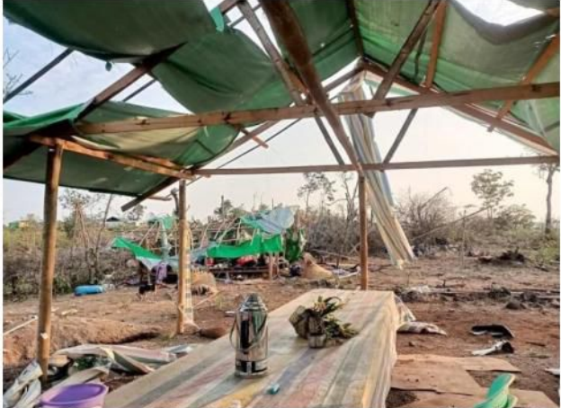
ဒီးမော့ဆိုအနောက်ခြမ်း အိုင်ဒီပီစခန်းများ လေယာဉ်ဖြင့် ဗုံးကြဲတိုက်ခိုက်ခံရ

မေလ ၂ရက်နေ့၊ ဒီးမော့ဆိုမြို့အရှေ့ဖက်ခြမ်းရှိ ဒေါညေးခူရွာခံ (၃)ဦးတို့မှ မနက် ၈ နာရီခွဲခန့်တွင် ရွာအတွင်း ပစ္စည်းပြန်ယူချိန်တွင် စစ်ကောင်စီတပ်မှ သေနတ်ဖြင့် ပစ်ခတ်ခဲ့ရာ ရွာသား (၃)တို့မှ ထွက်ပြေး လွတ်မြောက် သွားခဲ့ပါသည်။