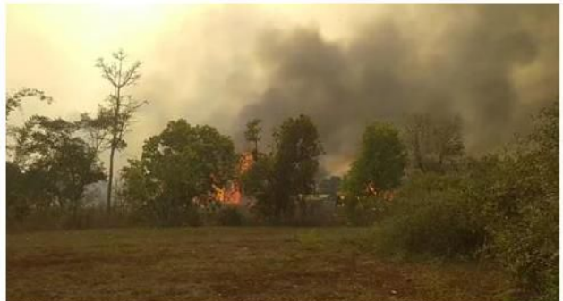
ရေနီပေါက်ကျေးရွာမှ ဘုန်းကြီးကျောင်း လက်နက်ကြီးမှန်ပျက်စီး၊ ဘောလခဲ ဒေါတမကြီးကျေးရွာအုပ်စုအား လေကြောင်းဖြင့်ပုံးကြဲတိုက်ခိုက်၍ နေအိမ်များမီးလောင်ပျက်စီး

မတ်လ ၂၄ရက်၊ နေ့လည် ၁၀ နာရီကျော်အချိန်ခန့်တွင် ဒီးမော့ဆိုမြို့အနောက်ဘက်ခြမ်းကို စစ်ကောင်စီတပ်မှ လက်နက်ကြီးများပစ်ခတ်ခြင်းကြောင့် အရပ်သား (၂)ဦးထိမှန်ကာ နေအိမ်တစ်လုံး ထိမှန်ပျက်စီးခဲ့ပါသည်။ နေ့လည် ၁ နာရီ ၁၅ မိနစ်အချိန်တွင် စစ်ကောင်စီတပ်များသည် တိုက်လေယာဉ်တစ်စီး၊ ရဟတ်ယာဉ်နှစ်စီးဖြင့် ဒီးမော့ဆိုမြို့နယ် ဒေါတမကြီးကျေးရွာအတွင်းသို့ (၃)ကြိမ် ပုံးကြဲတိုက်ခိုက်ခဲ့သည်။