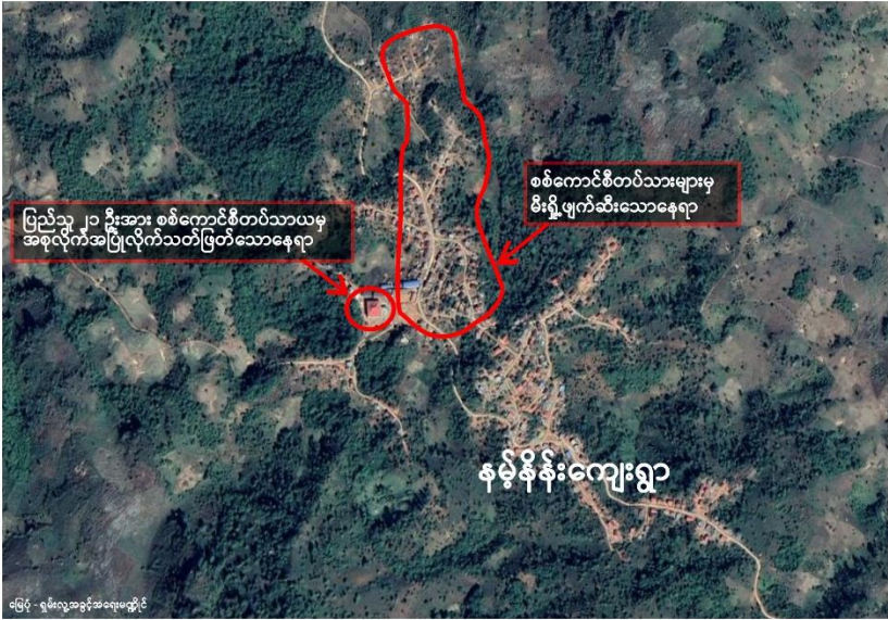
နမ့်နိန်းကျေးရွာ နေအိမ်မီးရှို့ခံရပြီး အစုလိုက်အပြုံလိုက်သတ်ဖြတ်ခံရသောနေရာ

ရှောင် နေရသော ဒေသခံအချို့၏ ပြောကြား ချက် အရမတ်လ ၉ ရက်နေ့မှ ၁၁ ရက်နေ့အထိ စစ် ကောင်စီသည်လေကြောင်းမှ တိုက်ခိုက်မှု ၁၅ ကြိမ် ထက်မ နည်းပြု လုပ်ခဲ့သည်ဟုသိရသည်။