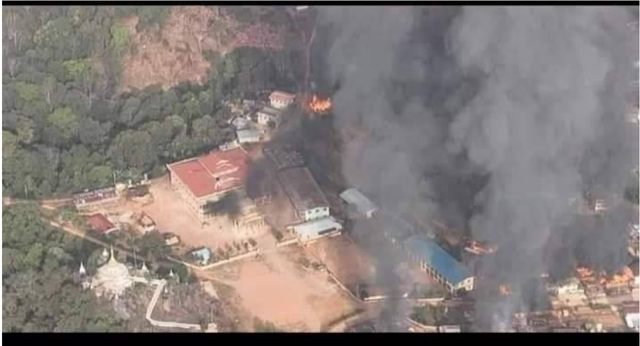
နမ့်နိန်းကျေးရွာတွင် စစ်ကောင်စီမှမီးရှို့ပျက်ဆီးသောနေအိမ်များ

စစ်ကောင်စီတပ်သားများသည် ကျေးရွာအတွင်းရှိ နေအိမ်များကိုမီးရှို့ခဲ့ကြရာ အိမ်ခြေ ၃၅၀ ခန့်ရှိသော နမ့်နိန်း ရွာမှ အိမ်ခြေ ၁၅၀ ထက်မနည်းမီးလောင်ပျက်စီးခဲ့သည်။