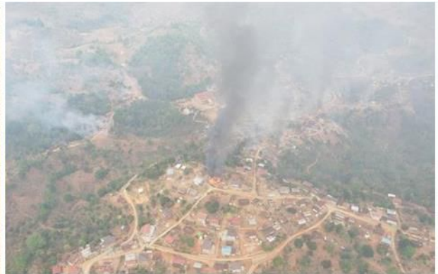
နေအိမ်များ မီးရှို့ဖျက်စီးခံရသော ပင်လောင်းမြို့နယ်

မတ်လ ၁၂ရက်၊ ဖရူဆိုမြို့နယ်အတွင်း တိုက်ပွဲဖြစ်ပွားခြင်းမရှိဘဲ စစ်ကောင်စီတပ်မှ လက်နက်ကြီးများ ရမ်းသန်းပစ်ခတ်မှုကြောင့် အသက် (၃၀)ဝန်းကျင် အမျိုးသမီးတစ်ဦး ထိခိုက်ဒဏ်ရာရရှိခဲ့ကာ နေအိမ် (၃)လုံး ထိမှန်ပျက်စီး ခဲ့ပါသည်။ ရှမ်း-ကရင်နီနယ်စပ်ရှိ စစ်ရှောင်စခန်းတစ်နေရာကို စစ်ကြောင်းထိုးလာသည့် စစ်ကောင်စီ တပ်မှ အသက် (၈၁)နှစ်အရွယ်အဖွားနှင့်အသက် (၇၈)နှစ်အရွယ်အဖိုးအိုတစ်ဦးတို့အား မီးရှို့ သတ်ဖြတ်ခဲ့ပြီး (၇)တန်းကျောင်းသားတစ်ဦးကိုလည်း ပစ်သတ်ခဲ့ပါသည်။ ထိုတရက်တည်းတွင် ဒီးမော့ဆိုမြို့နယ်၊ ဒေါတမကြီးနှင့်ဒေါညေးခူကျေးရွာတို့တွင် တိုက်ပွဲဖြစ်ပွားခဲ့ပြီး စစ်ကောင်စီတပ်မှ ဒေါညေးခူ ကျေးရွာရှိနေအိမ် အလုံး ၃၀ ခန့် မီးရှို့ဖျက်စီးခဲ့သည်။