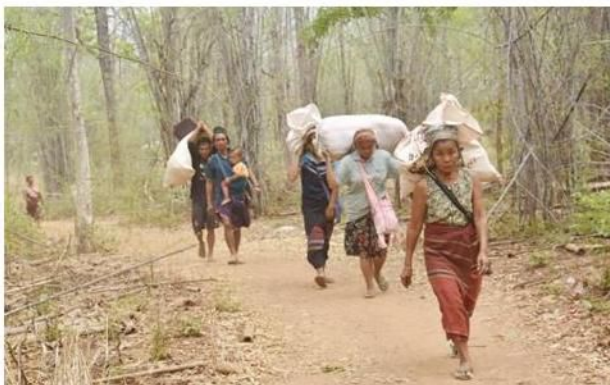
စကစ ထိုးစစ်ဆင်မှုကြောင့် ဒေသခံများ ထွက်ပြေးတိမ်းရှောင် ဒီးမော့ဆိုမြို့နယ်

မိနစ်အချိန်တွင် ကရင်နီပူးပေါင်းတပ်များနှင့် စစ်ကောင်စီတပ်များသည် ဖယ်ခုံမြို့ပနယ်၊ ကုရင်ကျေးရွာအုပ်စု အတွင်း တိုက်ပွဲဖြစ်ပွားခဲ့ပြီး စစ်ကောင်စီတပ်မှ ၁၉ ဦးသေဆုံးကာ ၆ ဦးအရှင်ဖမ်းမိပြီး လက်နက်ခဲယမ်း အချို့လည်း သိမ်းဆည်းရမိခဲ့သည်။ တစ်ရက်တည်းတွင် စစ်ကောင်စီတပ်မှ KA တပ်ရင်း(၃) တပ်စခန်းကို သိမ်းပိုက်ရန် ထိုးစစ်ဆင်လာမှုကြောင့် နှစ်ဖက်တိုက်ပွဲဖြစ်ပွားခဲ့ပြီး စစ်ကောင်စီတပ်များမှ ပြန်လည် ဆုတ်ခွါကာ စစ်ကောင်စီတပ်၏ အလောင်းနှစ်လောင်း တွေ့ရှိခဲ့သည်။ သည့်အပြင် ညနေ ၅ နာရီအချိန်တွင် စစ်ကောင်စီတပ်များမှ ဒီးမော့ဆိုမြို့နယ်၊ ဒေါကလော်ခူကျေးရွာအုပ်စု၊ ဒေါစဲကျေးရွာအား လေကြောင်းဖြင့် ဗုံးကြဲတိုက်ခိုက်ခြင်းများ ပြုလုပ်ခဲ့သည်။ ထို့အပြင် ညနေ ၄ နာရီအချိန်တွင် စစ်ကောင်စီတပ်များသည် ပင်လောင်းမြို့နယ်၊ နန်းနိမ့်ရွာမှ အရပ်သား ၃၀ဦးနှင့် သံဃာတော် ၃ ပါးတို့အား သတ်ဖြတ်ကာ နေအိမ် ၅၀ ကိုလည်း မီးရှို့ဖျက်စီးသွားခဲ့သည်။