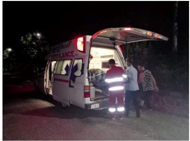
ဒေါ့ဒု ရွာသားတစ်ဦးမှ စကစ၏ ပစ်ခတ်မှုကြောင့် ထိမှန်ဒဏ်ရာရရှိ

ဇွန်လ ၂၈ရက်နေ့၊ ရှမ်းပြည်တောင်ပိုင်း၊ မိုးဗြဲမြို့၊ ဝါရီဆူးပလိုင်ကျေးရွာတွင် တပ်စွဲထားသည့် စစ်ကောင်စီ စစ်သားများအတွက် လက်နက်ကိုင်အဖွဲ့တစ်ဖွဲ့မှ ရိက္ခာများပို့ဆောင်ပေးနေပြီး ရိက္ခာပို့ဆောင်ပေးနေသော လက်နက်ကိုင်အဖွဲ့အား ကရင်နီကာကွယ်ရေးပူးပေါင်းတပ်ဖွဲ့များမှ ပစ်ခတ်ခဲ့သည်။ ထို့အပြင် ကာလရှည်ကြာစွာ တပ်စွဲထားခြင်းကြောင့် ဒေသခံပြည်သူများမှ လယ်ယာလုပ်ကိုင် စားသောက်နိုင်မှု မရှိတော့၍ စစ်ကောင်စီများ၏ ရိက္ခာများ ဖြတ်တောက်နိုင်ရန် ဤဝါရီဆူးပလိုင်ကျေးရွာအား KNDF, MBPDF တို့မှ စစ်ဇန်အဖြစ် သတ်မှတ် လိုက်သည်။