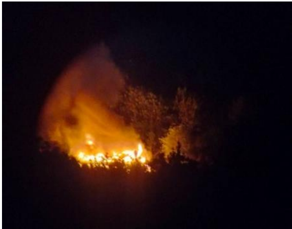
စကစမှ နန်းပေါ်လုံ ကျေးရွာအား မီးရှို့ခြင်း

တိုက်ပွဲပြင်းထန်ခဲ့ပါသည်။ ထိုတိုက်ပွဲအတွင်း တော်လှန်ရေးတပ်ဖွဲ့များမှ (၃)ဦး မစိုးရိမ်ရသည့် ဒဏ်ရာရရှိခဲ့ပြီး စစ်ကောင်စီတပ်၏ အထိအခိုက်၊ အကျအဆုံးများ မသိရှိရချေ။