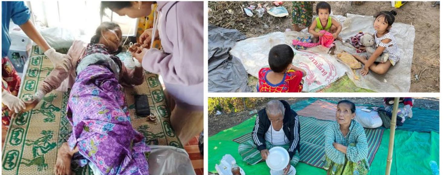
ပလောတာပြိုတွင်ရှိသော နေရပ်စွန့်ခွာသူများနေထိုင်သည့်နေရာ၊ ပလူးဖိုး၊ မြဝတီတောင်ပိုင်း၊ ဒူးပလာယာခရိုင်။

မြန်မာ့တပ်မတော်၏ တိုက်ခိုက်မှုနှင့် ချိုးဖောက်ကျူးလွန်မှုများမှ ထွက်ပြေးလာသော ဒုက္ခသည်များအား အကာအကွယ်နှင့် နေရာ ထိုင်ခင်းပေးရန် နှင့် လူသားချင်းစာနာမှု အေဂျင်စီများအနေဖြင့် ထို ဒုက္ခသည်များအား ထိတွေ့ပြီး ကူညီခွင့် ပြုရန် KPSN က ထိုင်းနိုင်ငံကိုလည်း တိုက်တွန်းလိုက်သည်။