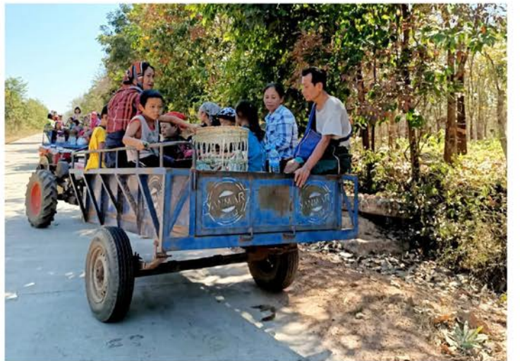
ဒူးပလာယာခရိုင်၊ မြဝတီတောင်ပိုင်း၊ ဝေါလေဒေသမှ တိုက်ပွဲကြောင့် နေရပ်စွန့်ခွာရသော ဥကရစ်ထရွာသူရွာ သားများ (ဇွန် ၂၆၊ ၂၀၂၂)