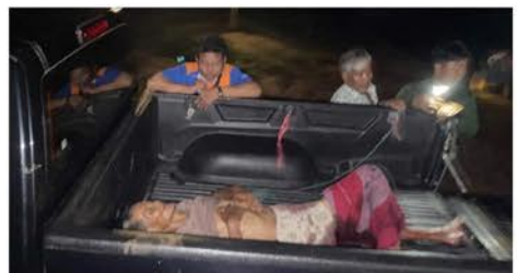
စစ်ကောင်စီ၏ လေကြောင်းတိုက်ခိုက်မှုကြောင့် ဒဏ်ရာရရှိခဲ့ သည့် သေဘောဘိုးရွာသား (ဇူလိုင် ၁၊ ၂၀၂၂)