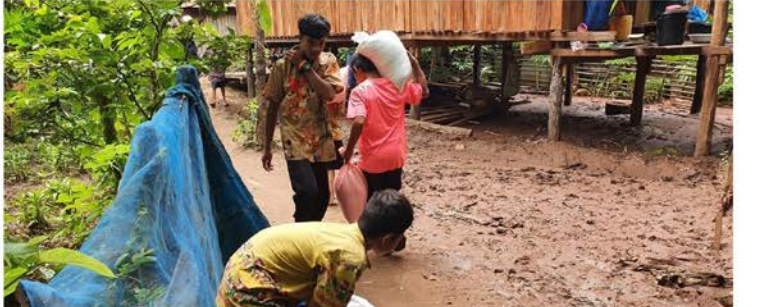
ဒူးပလာယာခရိုင်၊ ဥကရစ်ထနှင့် လယ်ကော်တွင် ဗမာ့စစ်တပ်၏ လက်နက်ကြီးဒဏ်နှင့် လေကြောင်းတိုက်ခိုက်မှု ဒဏ်များကြောင့် အိုးအိမ်စွန့်ခွာခဲ့ရသူများကို ကရင်လူမှုအဖွဲ့အစည်းများမှ အရေးပေါ်လိုအပ်ချက်များ ကူညီဆောင်ရွက်ပေးနေခြင်း