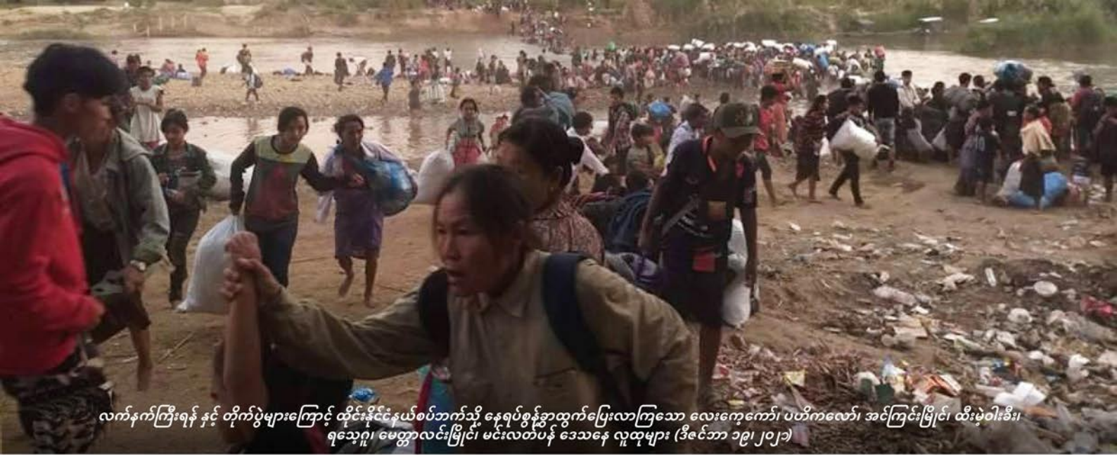
လက်နက်ကြီးရန်နှင့် တိုက်ပွဲများကြောင့် ထိုင်းနိုင်ငံနယ်စပ်ဘက်သို့ နေရပ်စွန့်ခွာထွက်ပြေးလာကြသော လေးကျောက်၊ ပဟိကလော်၊ အင်ကြင်းမြိုင်၊ ထီးမဲဝါးစီး၊ ရသေ့ဂူ၊ မေတ္တာလင်းမြိုင်၊ မင်းလတ်ပန် ဒေသနေ လူထုများ (ဒီဇင်ဘာ ၁၉၊ ၂၀၂၁)