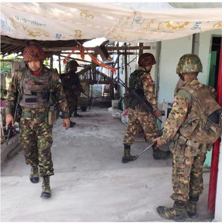
တိုက်ပွဲဖြစ်ပွားခင်က လေးကေ့ကော်တွင် စစ်ကောင်စီတပ်သားများမှ တစ်အိမ်ဝင်တစ်အိမ်ထွက်ရှာဖွေမှု များပြုလုပ်ခြင်း