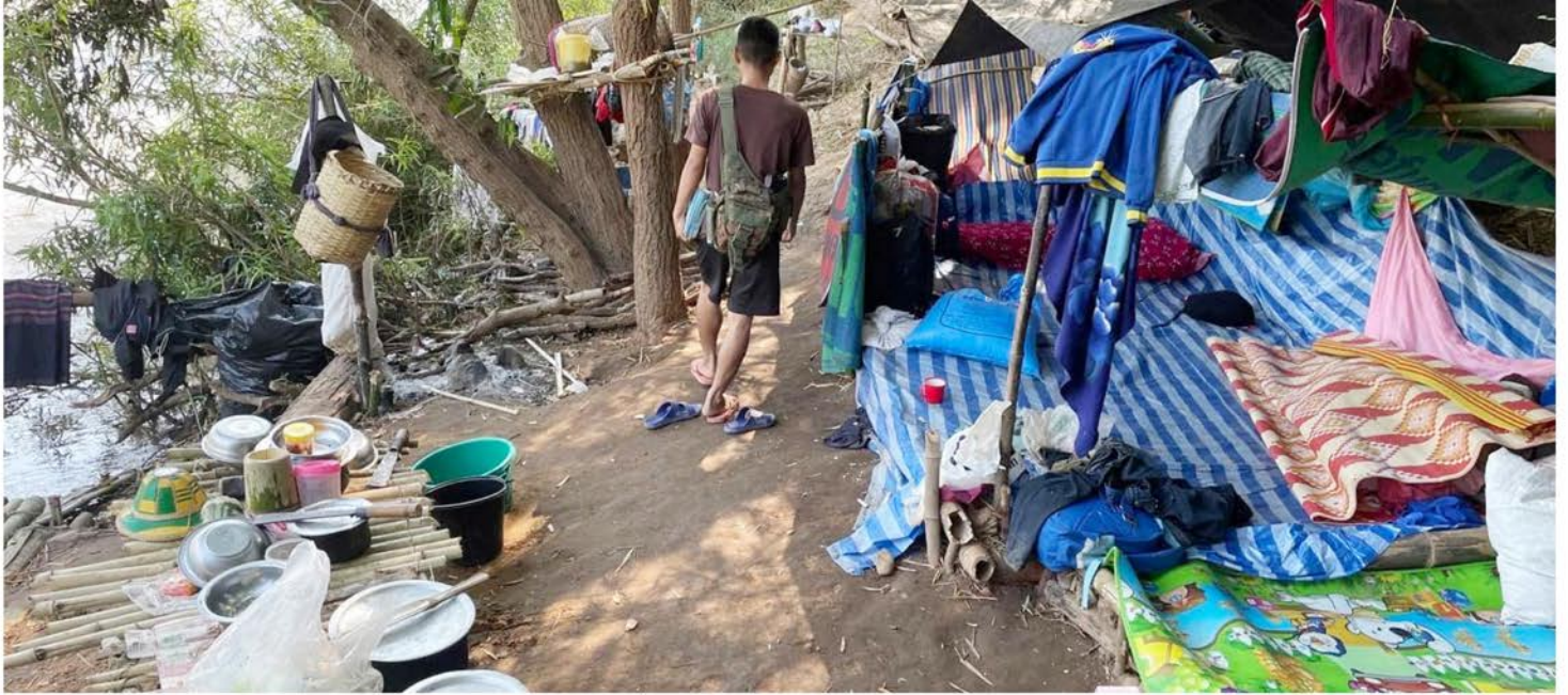
ဒူးပလာယာခရိုင်၊ မြဝတီတောင်ပိုင်း၊ သေဘောဘိုးရွာ မြစ်ကမ်းဘေးမှ အိုးအိမ်စွန့်ခွာခဲ့ရသူများ နေထိုင်သည့်နေရာ (ဇန်နဝါရီ ၂၀၂၂)