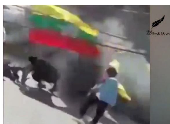
မာ်,တိုက်,ခင်းဝင်းတးခီးလိက်း မိုင်း;ဝခင်းထိ 1/2/2022

ပင်ခခေဂင်လုံဂမ်.ထိမ်သိုင်းမခင်း;ယိုတ်းကမ်းခေတ်း,လိုင်;မိုင်းခခေင်. လတ်းရှိုတ်းခင်းပင်လိမ်းမာ်, ခခင် သခင်လွံတံး (Shan Yoma) ခင်းဝင်းတးခီးလိက်းမိုင်း;ဝခင်းထိ 1/2/2022 ဝခင်းခွပ်,ခွပ်,ခိုင်;ပီ ကခင်းသိုင်း မခင်း; ယိုတ်းကမ်းခေတ်း, လိုင်;မးမိုင်း;ပီဂံ ဝခင်းထိ 1/2/2021။ ဂူခင်းလိုင်;ခင်းရှမ်းဂမ်. ထိမ်ပင် ခခေဂင် လုံဂမ်.ထိမ်သိုင်းမခင်း;ခခေင်. ဂမ်းခခမ်ပိုင်လုက်;မေး ဂူခင်းသိုင်းမခင်း;ခပ်ငလး; ဂူခင်းတခင်းတင်းမိုင်း သတ်, ကခင်းလုမ်းပျို,တုလိတ်.လးရှု, တိုင်းခခင်းခင်းရှမ်း။