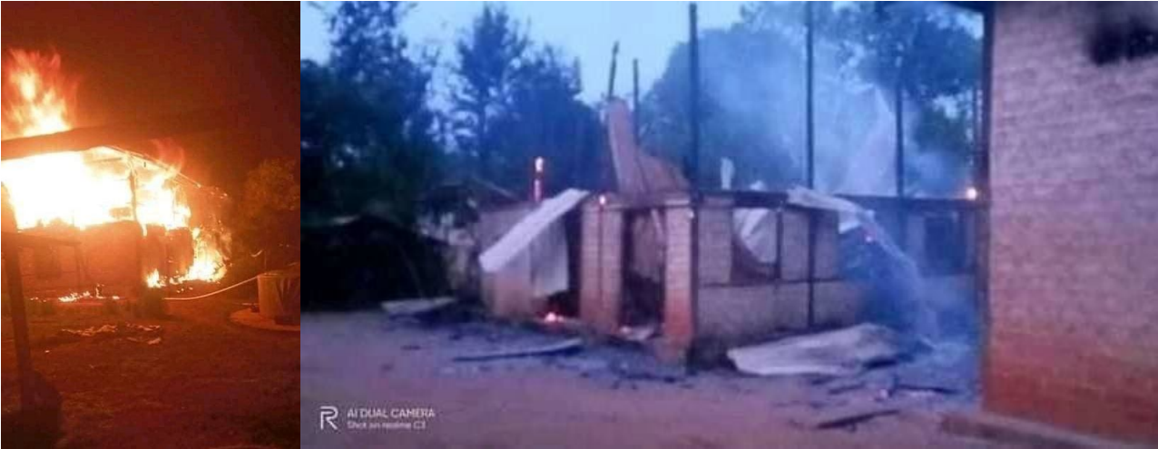
ရှ့ခင်းဂူခင်းဝါခင်း;လျ့.သိခေ်, ကခေင်သိုဂ်းမခင်း;ကပ်ဗုးလုတ်,

ဝခင်းထိ 13/4/2022 ခါးယါမ်းမွဂ်; 1 မူင်းဂါင်ခင် သိုဂ်းမခင်းမွဂ်; 20 ခီ,ဂးမး;ခေပ်ရှ့ခင်း;ကူးခေီ, ငလ;ကူး သီ, ခင်းဝါခင်း;လျ့.သိခေ်, ကိုင်,ခခေင်ခူင်,။