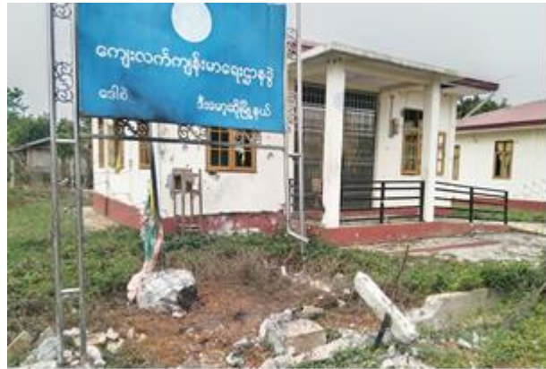
၀ကစ လက်နက်ကြီးကြောင့် ဆေးခန်းအဆောက်အအုံတစ်လုံး ထိမှန်ပျက်စီး ခေါ်စ

မတ်လ (၂၄) ရက်နေ့၊ ကရင်နီပြည် ဖရူဆိုမြို့နယ် ငွေတောင်ရွာသစ်ကျေးရွာသို့ စစ်ကြောင်းထိုးလာသော အင်အား ၅၀ ဝန်းကျင်ခန့် စစ်ကောင်စီတပ်များနှင့် ဒေသခံ ကာကွယ်ရေးတပ်ဖွဲ့တို့ တိုက်ပွဲဖြစ်ပွားခဲ့ပြီး နှစ်ဖက်အကျအဆုံးရှိခဲ့ကြောင်း KNDF B-15 မှ ထုတ်ပြန်သည်။ တိုက်ပွဲအတွင်း စစ်ကောင်စီတပ်မှ ဒေသခံ နေအိမ်များအား မီးရှို့ဖျက်စီးမှုများ ရှိနေပြီး ၎င်းအရေအတွက် အတိအကျအား မသိရှိရသေးပေ။ ထို့အပြင် ရှမ်းပြည်နယ် တောင်ကြီးတွင် ကရင်နီစစ်ဘေးရှောင်ပြည်သူများအား ကူညီပေးနေသူ ပရဟိတလူငယ် (၆)ဦးကို စစ်ကောင်စီတပ်များမှ ဖမ်းဆီးလိုက်သည်။