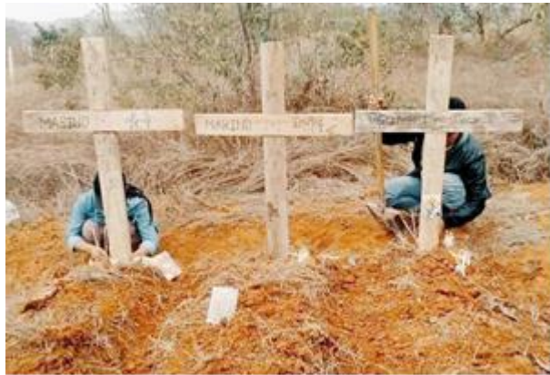
သတ်ဖြတ်ခံရသည့် အရပ်သား (၃)ဦး ဒေါ်ဥဒုရုပ်ကွက် လျှင်ကော်

မတ်လ (၂၅)ရက်နေ့၊ ဒီးမော့ဆိုမြို့နယ်၊ စံပြ ၆ မိုင်ကျေးရွာတွင် စစ်ကောင်စီတပ်များ စစ်ကြောင်းထိုးလာပြီး ကရင်နီတပ်မတော် (KA) ၊ KNDF B-09၊ KNDF B-19 ၊ PDF တပ်ရင်း ( D ) တို့ ထိတွေ့ တိုက်ပွဲ နှစ်ကြိမ်ဖြစ်ပွား ခဲ့သည်။ နံနက် ၁၀နာရီတွင် ဒီးမော့ဆိုမြို့ ၆မိုင်အုပ်စု ဘက်တလိန်ကျေးရွာ လမ်းမကြီးတစ်လျှောက်နှင့် ပန်ကန်း၊ ဒေါ်ပိုးစီလမ်းမကြီးတစ်လျှောက် ထိုးဖောက်ဝင်ရောက်လာပြီး ညနေပိုင်း ၄နာရီအချိန်တွင်စတင် ထိတွေ့တိုက်ပွဲ ဖြစ်ပွားခဲ့သည်။ တိုက်ပွဲအတွင်း စစ်ကောင်စီတပ်များမှ ငါးမိုင်ကျေးရွာရှိ လူနေအိမ်များအား မီးရှို့ဖျက်ဆီး သွားခဲ့သည်။ သည့်အပြင် မတ်လ ၂၆ရက်နေ့ နံနက် ၇နာရီ ၄၅မိနစ်မှစပြီး စစ်ကောင်စီတပ်များမှ ငါးမိုင်ကျေးရွာရှိ လူနေအိမ်များအား ဆက်လက်မီးရှို့ဖျက်ဆီးမှုများ ပြုလုပ်သွားခဲ့သည်။