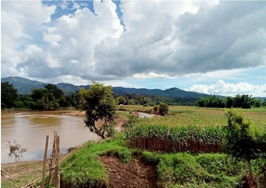
တီးလိတ်ရှ်းခေး ရှိုမ်းစမ;ခေခေ.ပာင် ကခင်ဂါခင်ခုတ်းထိုင်ခေ,ရှိုခင် လၢင်းမးယု.ဂပ်းလုလိတ်

လုင်းလံးဂုမ်းသု, ဗူးဂွမ်းကိုင်း, ခေးရှပ်, ခေ. လုမ်းသိုက်းမခင်းကခင်ရှပ်;ယိုတ်းကမ်းခေတ်; (ကု,ခေး) လိုင်းမိုင်းမး ဂေး.လိုက်;ခိုခင်းမးငလး; ဗူးဂွမ်းကိုင်း,ဂေး.ခေ. ရှိုတ်းသင်ဂေး မခင်းကမ်,ယူ,ဗူး,ဂုခင်း မိုင်း။ ဗူးဂွမ်းကိုင်း,ဂေး.ဂပ်, ပိခင်လံးပွမ်း။ မခင်းလံးရှပ်;တင်း ရှပ်; ဝါခင်းသေ ကွခင်သါခင်ခတ်းဂါခင် ခုတ်းထိုင်,ရှိုခင် ခင်းပိ 2020 ငလး;လုးလုမ်းပျီ,တုလိတ်.ခပ် လွက်,ငိုတ်;ဝံ.ဗွင်းခေခေ.။