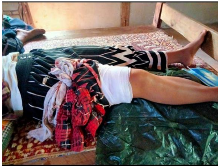
စစ်ကောင်စီ လက်နက်ကြီးပစ်ခတ်မှုကြောင့် ထိခိုက်ဒဏ်ရာရရှိသော ထီးပေါ်ဆိုအမျိုးသမီး

၂၀၂၁ ခုနှစ်၊ ဩဂုတ်လ (၁၂) ရက်နေ့တွင် ဖရူဆိုမြို့နယ် ထေးကလူဒေါကျေးရွာအနီးတွင် ကရင်နီတပ်မတော်၊ ကရင်နီအမျိုးသားများကာကွယ်ရေးတပ်နှင့် စစ်ကောင်စီတို့ တိုက်ပွဲဖြစ်ပွားကာ စစ်ကောင်စီတပ်မှ (၅)ဦး သေးဆုံးပြီး (၃) ဦး ဒဏ်ရာရရှိသည်။ ထိုတိုက်ပွဲတွင် စစ်ကောင်စီ၏ လက်နက်ငယ်အချို့နှင့် လက်နက်ကြီး တစ်လက် သိမ်းဆည်းရမိကြောင်း ကရင်နီအမျိုးသားများ ကာကွယ်ရေးတပ်မှ အတည်ပြုသည်။ ထို့နောက် စစ်ကောင်စီမှ ၎င်းတို့၏ တပ်အင်အားများအား ဖရူဆိုမြို့နယ်တွင် ထပ်မံဖြည့်တင်းပြီး တရက်တည်းတွင် ဖရူဆိုမြို့နယ် ကဒါးလား ကျေးရွာအနီးတွင်လည်း ကရင်နီတပ်မတော်၊ ကရင်နီအမျိုးသားများကာကွယ်ရေးတပ်နှင့် စစ်ကောင်စီတို့ တိုက်ပွဲဖြစ်ပွားခဲ့သည်။ တိုက်ပွဲပြင်းထန်မှုကြောင့် ဒီးမော့ဆိုအခြေစိုက် ခြေလျင်တပ်ရင်း၊ ခလရ (၁၀၂) နှင့် ဖရူဆိုမြို့နယ် ခမရ (၅၃၁)တို့မှ လက်နက်ကြီးများဖြင့် ပစ်ခတ်မှုကြောင့် ဖရူဆိုမြို့နယ် ထီးပေါ်ဆိုရွာမှ အမျိုးသမီးတစ်ဦးအား ပေါင်တွင် ထိမှန်ခဲ့ပြီး ဒီးမော့ဆိုမြို့နယ် ညောင်ကုန်းရွာသားတစ်ဦးအား လက်မောင်းတွင် ထိမှန်ခဲ့သည်။