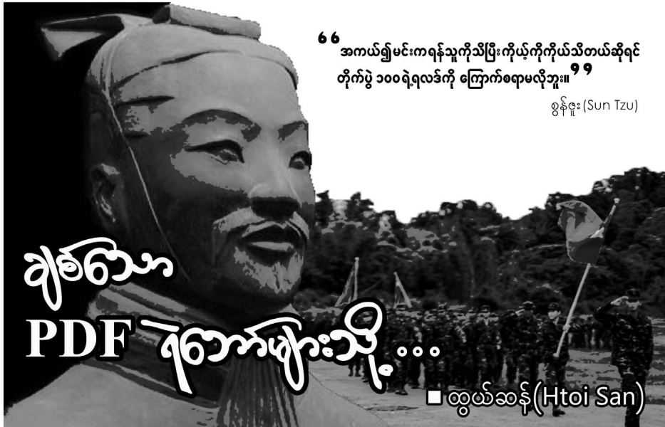
“အကယ်၍ မင်းက ရန်သူကိုသိပြီး ကိုယ့်ကိုကိုယ်သိတယ်ဆိုရင် တိုက်ပွဲ ၁၀၀ ရဲ့ရလဒ်ကို ကြောက်စရာမလိုဘူး။” ၆၆ စွန်ဇူး (Sun Tzu) ၆၇

“အကယ်၍ မင်းက ရန်သူကိုသိပြီး ကိုယ့်ကိုကိုယ်သိတယ် ဆိုရင် တိုက်ပွဲ ၁၀၀ ရဲ့ရလဒ်ကို ကြောက်စရာမလိုဘူး။” တရုတ် စစ်ဗိုလ်ချုပ်(စစ်ဘုရင်လို့တင်စားကြတဲ့) စွန်ဇူး (Sun Tzu) ရဲ့ စကားပါ။ ဘာကြောင့် ဒီစကားလေး ကိုးကားရသလဲဆို သေရဲ တယ်၊ တိုက်ရဲတယ်၊ မကြောက်ဘူးဆိုတာလောက်နဲ့ စစ်တိုက် လို့မရပါဘူး။ အဓိကကတော့ စစ်ပွဲတစ်ခုကို တိုက်တော့မယ်ဆိုရင် အခြေအနေတွက်ချက်မှု မှန်ကန်ဖို့လိုပါတယ်။ ရန်သူ လူအင်အား၊ လက်နက် အင်အား၊ ငွေအင်အား၊ နေရာအကျယ်အဝန်း၊ ရန်သူ စခန်း၊ အထိုင်၊ အရွေ့၊ ရန်သူဗျူဟာ၊ ရန်သူနည်းနာ၊ ရန်သူ အသုံး ပြုတတ်တဲ့ တိုက်ပွဲသဏ္ဍာန်၊ အချိန်၊ လက်နက်အမျိုးအစား၊