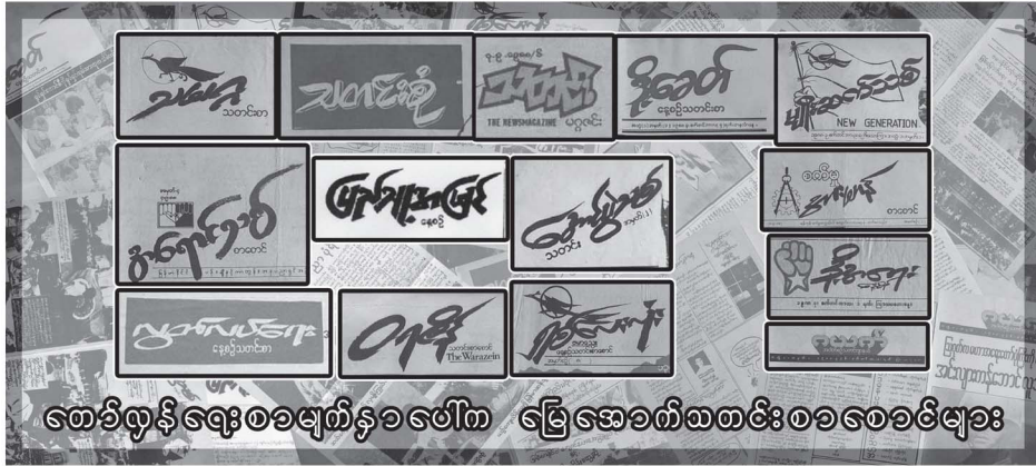
ဖော်ပြရန် ရေးစာမျက်နှာပေါ်က ရွှေအောင်စာပေစာပေစာပေစာပေ

စစ်အာဏာရှင်ကို လူတန်းစားတစ်လုံး ဆန့်ကျင်တော်လှန်ခဲ့ကြတဲ့ ရှစ်လေးလုံး အရေးတော်ပုံကြီး (၃၃)နှစ် တိုင်ခဲ့ပြီ။ အာဏာရှင်ဆန့်ကျင် ဖြတ်ချရေးမပြီးဆုံး သေးတဲ့ တော်လှန်ရေးဟာ ၂၁ မျိုးဆက်သစ်တို့ရဲ့တာဝန်အဖြစ် လက်ဆင့်ကမ်းခဲ့ ပြီ။