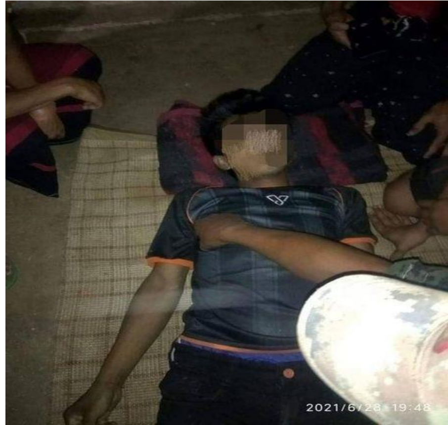
ဆိုင်ကယ်စီးလာပြီး စစ်ကောင်စီ ပစ်ခတ်သတ်ဖြတ်ခြင်းခံရသော လူငယ် တစ်ဦး၏ အလောင်း ဇွန် ၂၈ ရက်နေ့။

ဇွန်လ ၂၂ ရက်နေ့မှ ဇူလိုင် ၄ ရက်နေ့အတွင်း သတ်ဖြတ်ခံရသော လူဦးရေမှာ ၁၂ ဦးဖြစ်ပြီး ဇွန်လ ၂၈ ရက်နေ့ ညနေပိုင်းအချိန်တွင် မိုးဗြဲမြို့မှ ဖယ်ခုံမြို့သို့ ဆိုင်ကယ်စီးလာသော လူငယ် တစ်ဦးအား စစ်ကောင်စီတပ် ၁၆၇ မှ ပစ်ခတ် သတ်ဖြတ်ခဲ့သောသူလည်း ပါဝင်သည်။