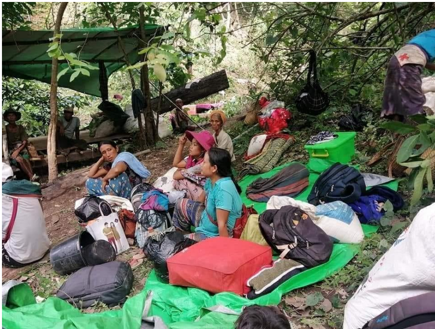
နန်းဖဲကျေးရွာအုပ်စုအတွင်း စစ်ဘေးရှောင်သစ်များ။

ဆက်လက်ချီ တက်ခဲ့သည်။ တိုက်ပွဲများ ကြောင့် တော်ရုံ ကျေးရွာအုပ်စုနှင့် နန်းဖဲကျေးရွာအုပ်စုတို့မှ ရွာသားများ ၂၆၂၉ ဦး နီးစပ်ရာ တောတွင်းသို့ ပုန်းရှောင်နေကြရသည်။ နန်းဖဲကျေးရွာသို့ ဝင်ရောက်လာသော စစ်ကောင်စီတပ်များသည် ရွာသားများ၏ အိမ်ပြတင်းပေါက် နှင့် တံခါးများအား ဖျက်ဆီးသွားခဲ့သည်။