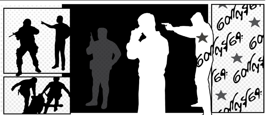
ဒီဂျစ်တယ်

ဒီတပတ်လည်း “ဆွန်ဇူး”ရဲ့ စစ်ပညာကျမ်းထဲကပဲ ရွေးထုတ်ဖော်ပြပေးချင်တယ်။ စစ်ကျမ်းအလိုအရ ကတော့ တနိုင်ငံလုံးကို စစ်မတိုက်ရဘဲ လက်နက်ချအညံ့ခံလာအောင်လုပ်တာက အခြေနေမပျက်သိမ်းလိုက်နိုင် ခြင်းကြောင့် အထက်တန်းအနိုင်ရခြင်းဖြစ်တယ်လို့ ဆိုတယ်။