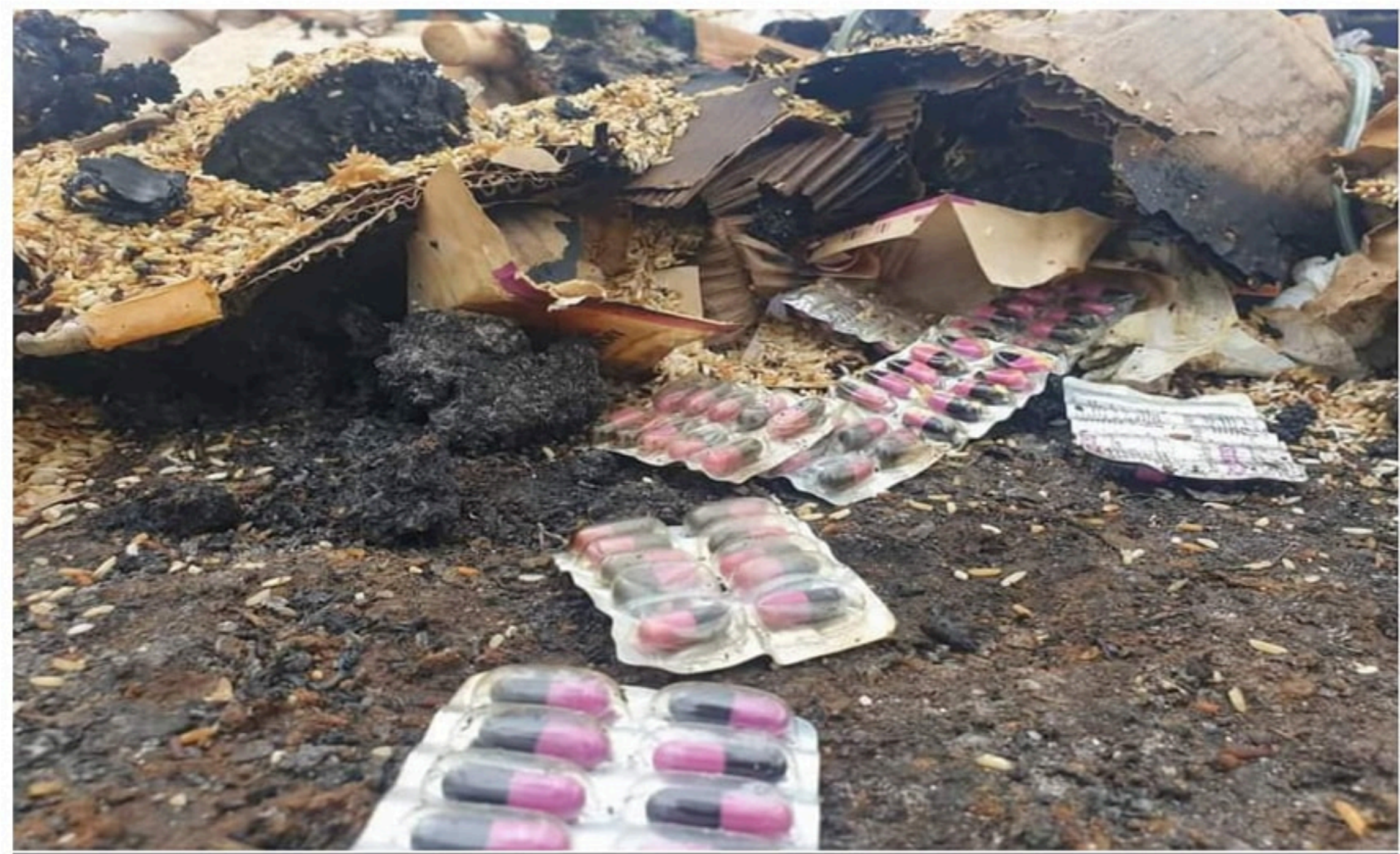
၂၀၂၁ ခုနှစ် ဇွန်လ ၁၂ ရက်နေ့တွင် ဖယ်ခုံမြို့အနီး စစ်ကောင်စီမှ စစ်ဘေးရှောင်များ၏ ဆေးဝါးနှင့် စားနပ်ရိက္ခာများကို မီးရှို့ဖျက်ဆီးပုံ

စစ်ကောင်စီအကြမ်းဖက်အဖွဲ့၏ စစ်အင်အားကြီးမားစွာ ဖြည့်တင်းနေခြင်း၊ အရပ်သား ပြည်သူများနှင့် စစ်ဘေးရှောင်ပြည်သူများကို ပစ်မှတ်ထားတိုက်ခိုက်ခြင်း၊ လူသားချင်း စာနာထောက်ထားမှု အရေးပေါ်ပစ္စည်းများကို ဖျက်ဆီးခြင်း စသည့်လုပ်ရပ်များသည် ကရင်နီပြည်သူများအပေါ် စစ်ကောင်စီ၏ လူမျိုးသုဉ်းသတ်ဖြတ်လိုရင်းကို ပေါ်လွင် ထင်ရှားစေသည်။