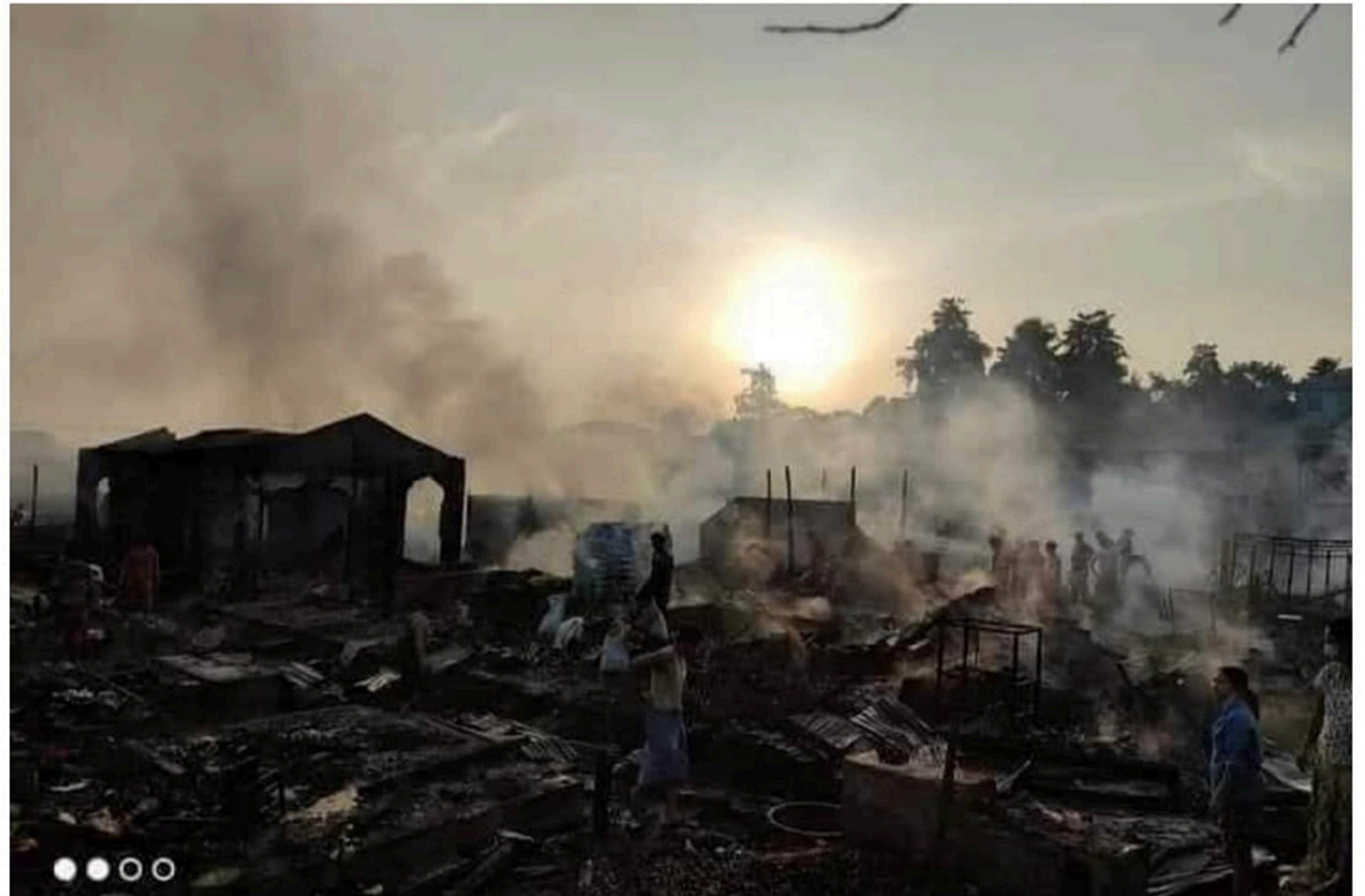
ပုံ ၃ - ဒီးမော့ဆိုမြို့နယ်တွင် စစ်ကောင်စီမှ လက်နက်ကြီးဖြင့် ပစ်ခတ်ပြီး ပြည်သူများ၏ အိုးအိမ်များကိုမီးရှို့ပုံ

အမှန်တကယ်မှာ စစ်ကောင်စီသည် လမ်းတံတားများကို ဖျက်ဆီးခြင်း၊ ဒေသခံများကို လူသားဒိုင်းအဖြစ်အသုံးပြုခြင်း နှင့် ပြည်သူပိုင်အဆောက်အဦများ ဖျက်ဆီးခြင်းတို့ကို ဆက်တိုက် လုပ်ဆောင်လျက်ရှိသည်။ လက်ရှိတွင် ကျေးရွာများကို လုံခြုံရေးယူပေးနေသောသူများမှာ KPDF ပင်ဖြစ်သည်။ စစ်ကောင်စီသည် ပြည်သူလူထုများကို လုံခြုံရာနေရာတွင် ခိုလှုံရန် သတိပေးထားသော်လည်း ပဋိပက္ခများဖြစ်ပွားနေသည့်အတွက် ခိုလှုံရန်လုံခြုံသည့် နေရာ မရှိပါ။ ဘုရားကျောင်း များ၊ ဘိုးဘွားရိပ်သာများတွင် သွားရောက် ခိုလှုံသည့်အခါတွင်လည်း စစ်ကောင်စီ၏ လိုက်လံ ဖမ်းဆီးခြင်း၊ ပစ်ခတ်ခြင်းများကို ခံရသည်။ ကရင်နီပြည်နယ်တွင် လုံခြုံသည့်နေရာ တစ်နေရာမှ မရှိပါ။