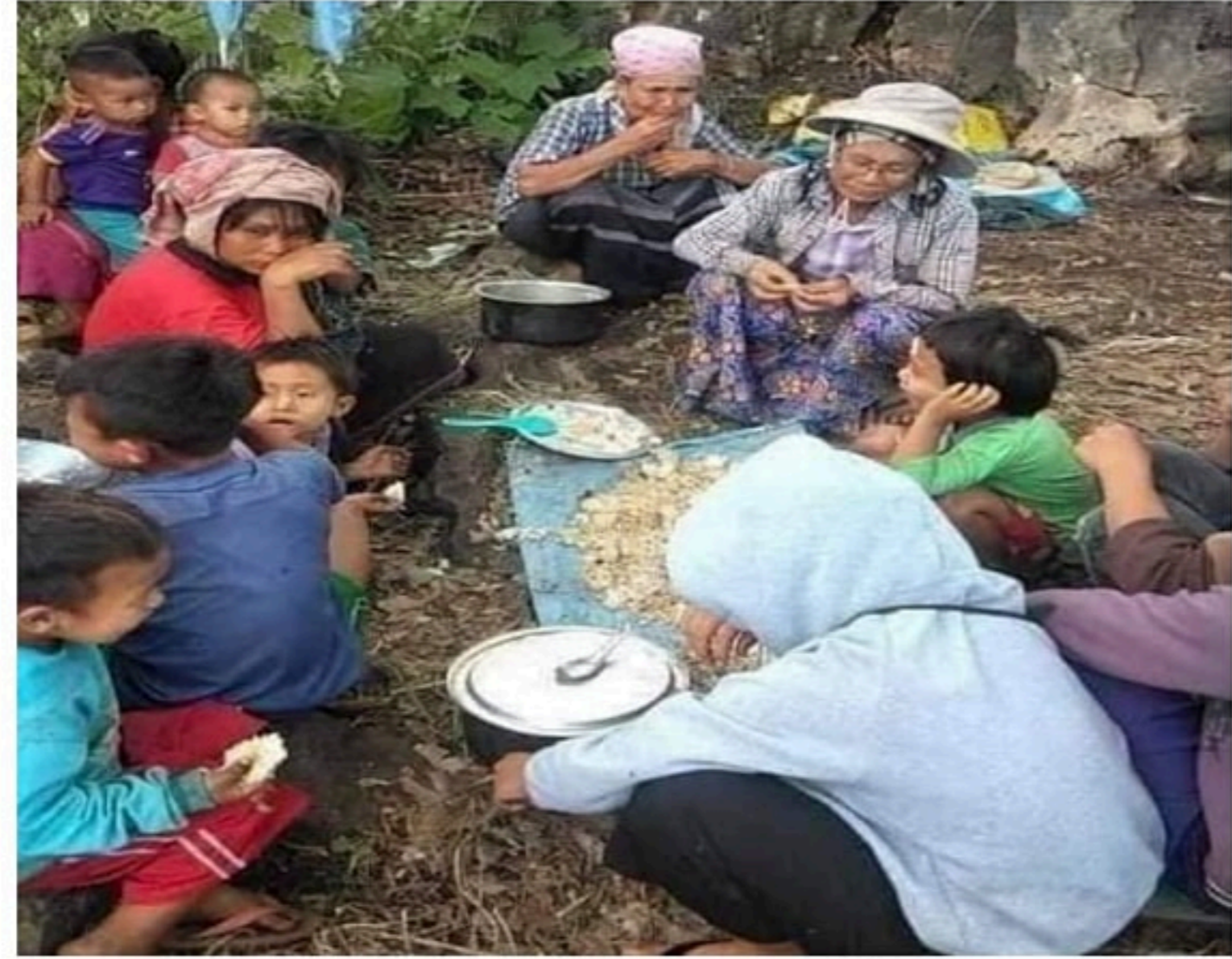
ပုံ ၂ -ဒီးမော့ဆိုမြို့နယ်မှ စစ်ဘေးရှောင်များ

ကရင်နီ အရပ်ဘက်အဖွဲ့အစည်းများကွန်ယက်မှ ကောက်ယူထားသော အချက်အလက်များအရ မေလ အလယ်ပိုင်းလောက်မှ စတင်ပြီး ကရင်နီပြည်နယ်နှင့် ဖယ်ခုံမြို့နယ်တွင် နေရပ်စွန့်ခွာရသည့် လူဦးရေ စုစုပေါင်း တစ်သိန်းကျော် ရှိပြီဖြစ်ကြောင်း သိရသည်။ လက်ရှိတွင် ကရင်နီပြည်နယ်၏ လူဦးရေမှာ သုံးသိန်း ၁ ရှိပြီး ဖယ်ခုံမြို့နယ်၏ လူဦးရေမှာ တစ်သိန်း ၂ ခန့်ရှိကြောင်း သိရသည်။ ထို့ကြောင့် ကရင်နီလူဦးရေ၏ လေးပုံတစ်ပုံမှာ နေရပ်စွန့်ခွာရသော စစ်ဘေးရှောင်များ ဖြစ်လာခဲ့ရသည်။