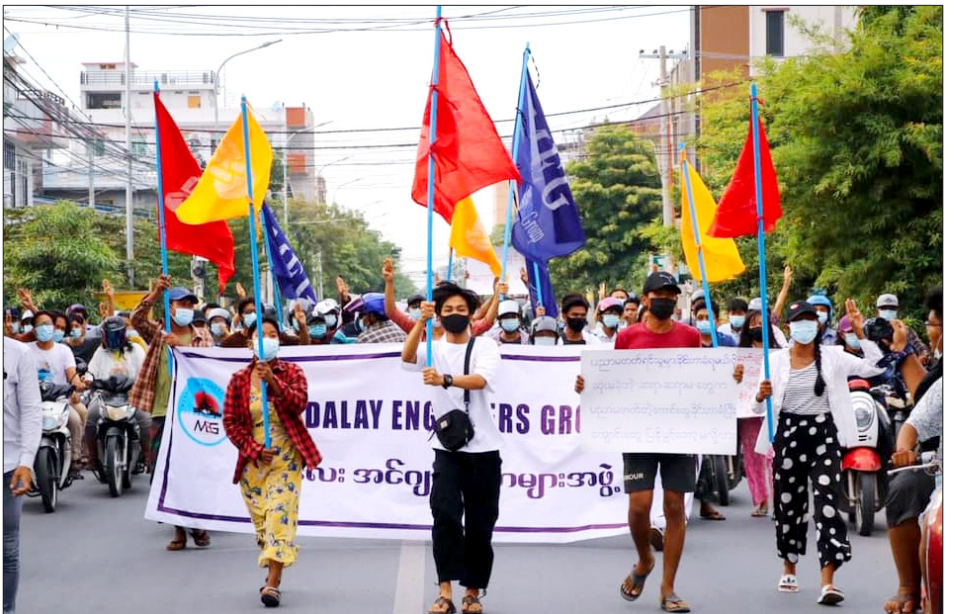
မေလ(၂၂)ရက်၊ မန္တလေးမြို့၌ လူအင်အားရာချီပြီး ချီတက်ခဲ့ကြသည့် မန္တလေးအင်ဂျင်နီယာသပိတ်စစ်ကြောင်းကို တွေ့ရစဉ်

ပြည်သူနှင့်တသားတည်း ရပ်တည်ခြင်းကြောင့် ပြည်သူ့ပါတီမှ နုတ်ထွက်ခြင်း ဖြစ်ကြောင်း နုတ်ထွက်ကြသည့် ပြည်သူ့ပါတီခေါင်းဆောင်ဟောင်း အချို့က ပြောကြားခဲ့