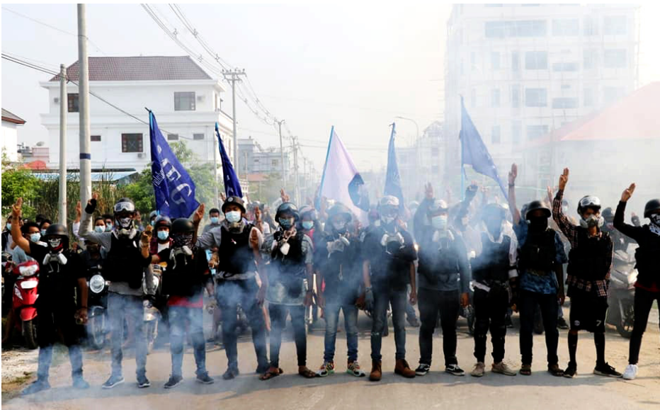
ဧပြီ ၁၅ ရက်၊ သင်္ကြန်အကြတ်နေ့၊ မန္တလေးမြို့ရှိ အင်ဂျီနီယာသပိတ်စစ်ကြောင်းကို တွေ့ရစဉ် - (ခေါတ်ပုံ-စီဂျေ)

ပြည်သူ့အသံ People Voice (PVTV) ရုပ်သံအစီအစဉ်များ ထုတ်လွှင့်ပြသမည်ဟု CRPH ကြေညာ