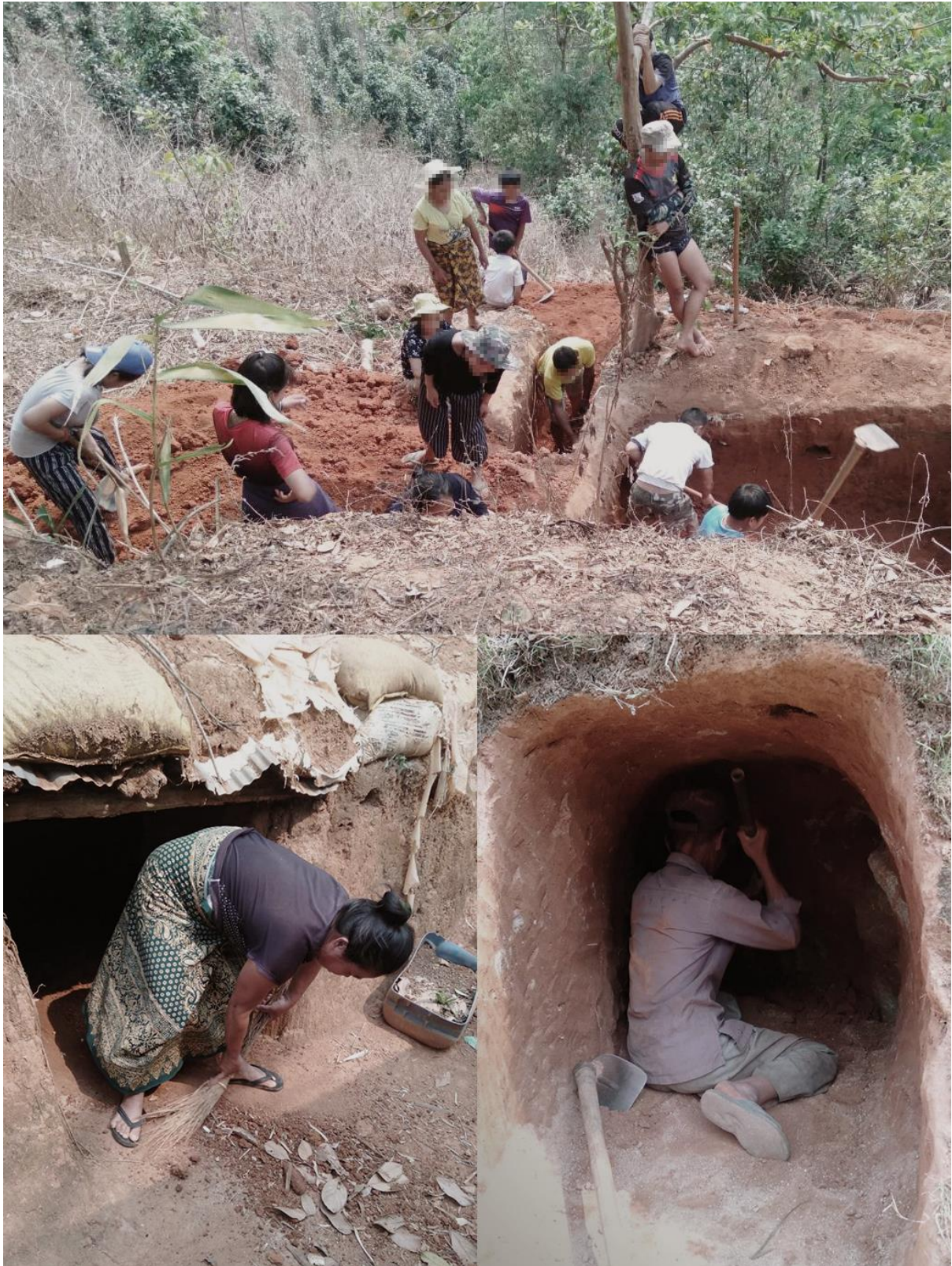
- ရှားဂူခင်းပါးလေးလံးရှားရှိုခင်းကွင်းတီးတူဝ်းတခင်း သင်သိုက်းမာခင်းပိုတ်,ခေးသိုက်းပိုတ်းယိုဝ်းတီးခိုင်; (နီပီးရှား - SSRC)