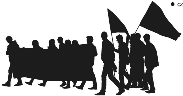
ဆောင်းပါး