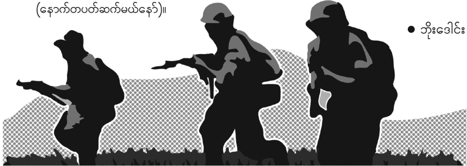
ဆောင်းပါး