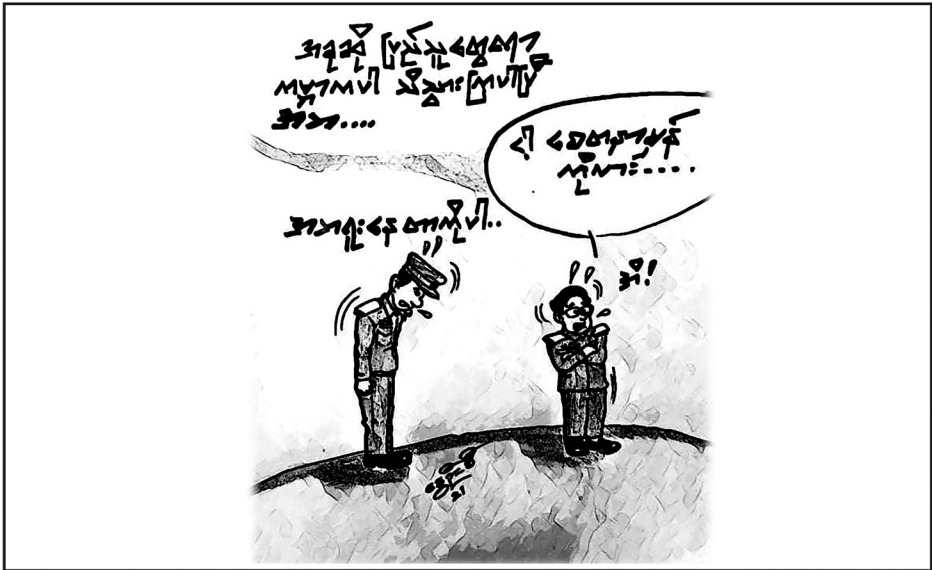
ဆောင်းပါး