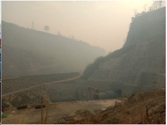
လွင်းလုဂ်.ရှိုခ်းခေဂေင်လုံ CDM ခွ်းဝိုင်းဂျှမ်းမေး ဝမ်းထိ 17/2/2021