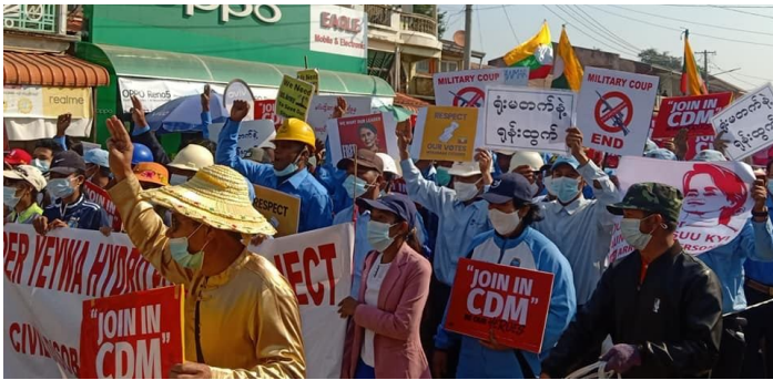
၁၇ ဖေဖော်ဝါရီလ ၂၀၂၁ တွင် ကျောက်မဲမြို့အတွင်း CDM အာဏာဖိဆန် ရေး ဆန္ဒပြလှုပ်ရှားမှု

ဖေဖော်ဝါရီ 1 ရက်နေ့မှ စ၍ သီပေါ ကျောက်မဲ မြို့များ အပါအဝင် မြို့နယ်ပေါင်းများစွာက စစ်ကောင်စီ အား ဆန့်ကျင်သည့် ဆန္ဒပြမှုများ နေ့စဉ်ရက်ဆက် ရှိနေပါသည်။ ဖေဖော်ဝါရီ 17 ရက်နေ့တွင် အထက် ရဲရွာ အလုပ်သမားများသည် “အထက်ရဲရွာ ရေအားလျှပ်စစ် စီမံကိန်း အာဏာဖိဆန်ရေး အရပ်ဖက် လှုပ်ရှားမှု” အင်္ဂလိပ်စာတမ်းကိုင်ဆောင်ကာ ကျောက်မဲမြို့တွင် ဆန္ဒပြပြည်သူများနှင့်အတူ ပူးပေါင်း