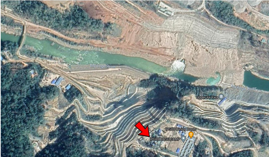
“IPGRB BASE CAMP” စာတန်းပါသော အထက်ရဲရွာရေကာတာဆောက်လုပ်ရေးဆိုက်ကို Google satellite မှ မြင်ရတဲ့ပုံရိပ်

ဖေဖော်ဝါရီ 1 ရက်နေ့မှ စ၍ သီပေါ ကျောက်မဲ မြို့များ အပါအဝင် မြို့နယ်ပေါင်းများစွာက စစ်ကောင်စီ အား ဆန့်ကျင်သည့် ဆန္ဒပြမှုများ နေ့စဉ်ရက်ဆက် ရှိနေပါသည်။ ဖေဖော်ဝါရီ 17 ရက်နေ့တွင် အထက် ရဲရွာ အလုပ်သမားများသည် “အထက်ရဲရွာ ရေအားလျှပ်စစ် စီမံကိန်း အာဏာဖိဆန်ရေး အရပ်ဖက် လှုပ်ရှားမှု” အင်္ဂလိပ်စာတမ်းကိုင်ဆောင်ကာ ကျောက်မဲမြို့တွင် ဆန္ဒပြပြည်သူများနှင့်အတူ ပူးပေါင်း