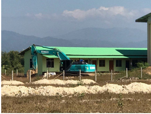
တီးလိုဝ်းသဝ်းဂူခင်းရှ်တီးဂါခင်းခွမ်းပခခီး

ယင်းမီးလွင်းထာင်,ထိုမ်ထိုင်,တုး ထာခင်း,ရှ်ခင်းဂမ်း,ခွင်းတေ ကပ်လုံ, ဖပ်တီးရှင်းဖပ်ထာခင်း,ရှ်ခင်း 23 မေးဂျေးဝတ်း ကခင်း ခွမ်းပခခီး မိခင်းစီတုံတိတ်လုံ,ခွာင့်တီး; ခွမ်းမသျှခင်းဂါခင်းလူင်းတိုခင်းမာခင်း (Myanmar Investment Commission) မိုဝ်းဝခင်းထိ 22/12/2017 ခခေင့်သေတိုဂ်ရှ်တီးသာင်;ယူ,တီးဝါခင်းခခေင့်ရှ်မ်း ကခင်း မိခင်းခင်းဂါခင်းမိုဝ်းရှ်းလေးတုးခီး; လီဂ်း ခခေင့်ယူ,ခပ်ယဝ်။ ခွမ်းပခခီး မိခင်းစီတုံတိတ် ခခွဲယင်းလုံ,ခွာင့် တုး,ခွတ်းထာခင်း,ရှ်ခင်းခင်းပိုခင်းတီး; ခခေင့်တုးပိုခင်းတီး; 0.2003 သီ,လီင်, ရီးလူဝ်းမေးတိုဝ်း တုး,ခါဝ်း တာင်းရှ်းပီ (တင်းခေ, ဝခင်းထိ 24/6/2015 ထိုင် 10/2/2020)။