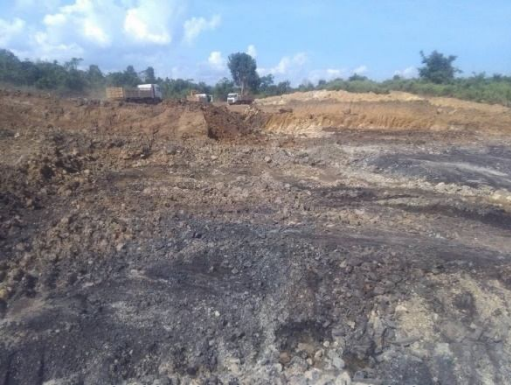
တီး,ခခင်းဂူခင်း,ခူခင်းတု,ခတ်းထာခင်း,ဂိုခင်း

မိုင်းဝခင်းထိ 17/10/2019 ခခေခ့်တူဝ်တံခင်းခွမ်းပခင်းတီး ခပ်ခပ်, ဂူ,ခင်းမိုင်းဂူခင်းသေ ဂိုတ်းပင်ဂုမ် လွမ်းဂူခင်းဝါခင်း တီး,ရွင်းဝါခင်း ဝိုင်း တင်း,ခတ,ခာပ်းယမ်း 3 မိုင်း 5 မိုင်းတီးဝခင်း။ ခပ်လတ်း တီး ဂူခင်းဝါခင်းဝါး ခပ်တေ“ခတ်းလမ်းတူလ်း” ထာခင်း,ဂိုခင်းကွခင်းတင်း တင်း, ခတ,ဝခင်းထိ 25/10/2019 ခခေခ့်ယဉ်။ ဂူလ်းဂး တင်း,ခတ, ခခေခ့် မး လွင်းဝါး ခပ်တေ ခတ်းဂူခင်း,ခူခင်းခခေခင်းဂေးလိင်း လိင်း မး ဂွမ်းဝါးခပ်တီး,ခခင်းပိုခင်းတီး,ခလး မီးဂွင်ထာခင်း,ဂိုခင်းခွင်ယှ်း,ဂွင် လူင် မးသေ မခင်း ခခေခ့်လှိုဝ်လွင်းဝါး“လမ်းတူလ်း”ခခေခ့်ယဉ်။