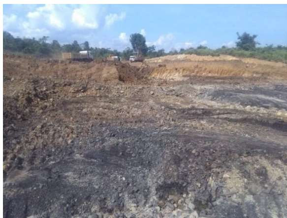
ကျောက်မီးသွေးတူးဖော်ရေးအတွက် ကြီးမားသော မြေရှင်းလင်းမှု

အောက်တိုဘာလ 17 ရက် 2019 တွင် ညနေ 3 နာရီမှ 5 နာရီ အချိန်အထိ ဝမ်ဝိန်းဘုန်းကြီးကျောင်း၌ ထိုင်းကုမ္ပဏီ ကိုယ် စားလှယ်များက ရွာသားများနှင့် လာရောက်တွေ့ဆုံပြီး အစည်း အဝေး တစ်ရပ်ပြုလုပ်ခဲ့သည်။ အောက်တိုဘာလ 25 ရက် 2019 ကစပြီးပထမသုတ် အစမ်းသဘောဖြင့်သာ ကျောက်မီး သွေးတူး ဖော်မည် ဟု၎င်းတို့က ထိုအစည်းအဝေးတွင် ပြော ကြား ခဲ့သည်။ သို့သော် ထိုတူးဖော်တဲ့ အရွယ်အစားမှာ အစမှာ ပင် ကြီးကျယ်သော မြေယာရှင်းလင်းခြင်းနှင့် အစမ်းသဘော သာ တူး ဖော်ခြင်းထက် တူး၍ဖော်ထုတ်ထားသည့် ကျောက်မီး သွေးပုံကို ကြည့်ပြီး အစမ်းမဟုတ်သည်ကို သိသာထင်ရှား ပါ သည်။