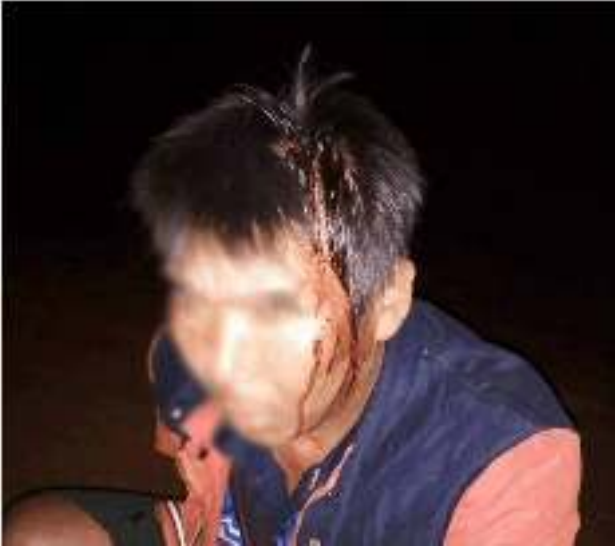
ရွာသူကြီး လုံးကောဝိ၏ခေါင်းဒဏ်ရာ

(၆) လုံးကောစံလှ၊ ပါစုတို့၏သား၊ အသက် ၃၈နှစ်ရှိစိုင်းစိန်တာသည် အချက်(၂၀) အရိုက်ခံရ