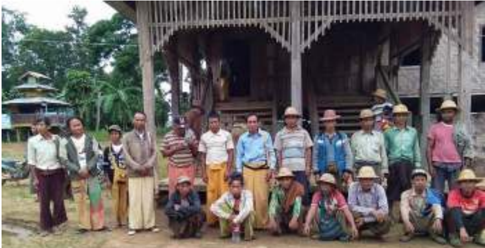
ဆင့်ခေါ်သွားခြင်းခံခဲ့ရသောဒေသခံရွာသားများနှင့်SNLD လွတ်တော်ကိုယ်စားလှယ် ပန်ကျန်ဘုန်းကြီးကျောင်း

ထို့နောက် ပိန်းနင်နှင့် အကြီးမှ ရွာသား ၁၅ ယောက်ကို နေရပ်အိမ်သို့ ပြန်လည်လွတ်ပေးရန် ခွင့်ပြု ခဲ့ကြောင်း။ သို့သော် ပန်ကျန်ရွာမှ ရွာသား ၂ ဦးကို ထိုနေ့တွင် ပြန်မလွတ်ပေးပဲ ၎င်းစစ်တပ်တို့ နှင့်အတူ ဩဂုတ် ၉ ရက် သူတို့ ၎င်းရွာမှ ထွက်ခွာသည်အထိ ဆက်၍ခေါ်ဆောင်ခဲ့သည်။