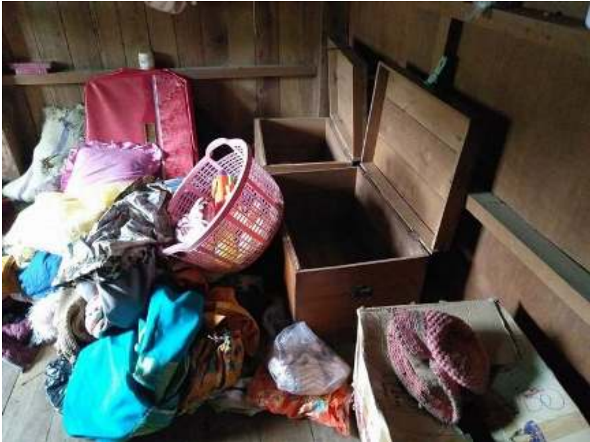
အစိုးရတပ်ခိုးယူလုယက်ခဲ့သော ဒေသခံရွာသားများ၏ပစ္စည်း

အရှေ့မြောက်ပိုင်းဒေသဆိုင်ရာစစ်ဌာနချုပ် (လားရှိုး) လက်အောက်ခံ နမ့်လန်အခြေစိုက် ခမရ ၅၀၅ နှင့် ခမရ ၅၀၆၊ နောင်ချိုအခြေစိုက် ခမရ ၅၀၄ တပ်ရင်း၃ရင်းမှ အစိုးရတပ်အင်အား ၆၀ ခန့်တို့သည် ဩဂုတ်လ ၉ ရက် ၂၀၁၈ ခုနှစ် ၁၀း၃၀ နာရီအချိန်တွင် ကျောက်မဲမြို့နယ် ပန်စံကျေးရွာအုပ်စု ပိန်းဆော့ ရွာကိုဝင်ခဲ့ပြီး ပါမန်၏နေအိမ်ကို အဓမ္မ ဝင်ခဲ့ကြောင်းသိရပါသည်။