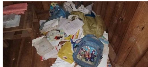
မိုဝ်းရှိုခင်းကခမ်သိုက်;မါခင်းသွက်;တပ်

ဝခင်းခခမ်. ဗွင်း 9:30 မုင်းဂါင်ခင်း သိုက်;မါခင်း 30 ပံ၊ ကခမ်လဝ်;ရှခမ် ကွင်,မိခင်းထုခင်း ကွခမ်ရှုဝ် ပး တင်း လုမ်းပျီ,တုလိတ်. သိပ်းခိုင်;လုက်.တါင်းဝါခမ်,လဝ်;-ခေးလုင်သေမး ရှင်.ထါမ်လံးဝုခင်း ကာယု 34 လုက်;လံး လုင်းလိင် + ပးခေခမ် ဂေး.ကခမ်တိုက်.မုင်းခေးမိုဝ်းရှိုခင်း။ သိုက်;မါခင်းခပ် ထါမ်မခင်းဝါး “လုင်း ဂါင်.သူပိခမ်ခင်း လွင်,မီးရှင်;? ရှင်;သူကခမ်ကပ်သိုဝ်,ဝံ.ခခမ်မီးတီးလှ်? ခမ်သေပေးထုပံ.တီးဂိုမ်; (1)ဂမ်း ကပ်တိခမ်ပိတ်.သို,လွမ်းကိပ်လံးဝုခင်းထိင်း(3) ဂါမ်းသေပွံ,ခိုခင်း။