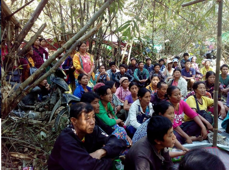
IDPs from Awng Lawt fleeing in the jungle