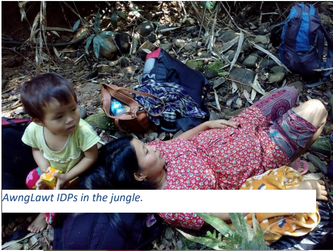
AwngLawt IDPs in the jungle.