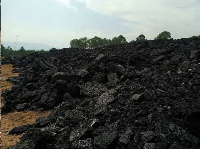
ရွင်ထာမ်ဂိုမ် ကမ်ခုတ်ကွက်ဂွင်ဝံ ဆွဲကွင်းတီးခုတ်ထာမ်

ပိုမ်.တီးခုတ်ထာမ်,ရှိခ်ခံ. မီးယူ,ဝံ.ခင်းထိုခ်,လွံ ကမ်မီးကွင်း; ခမးခမ်.လံလံသံ လိုင်းခေင်, ခမ်.ရှုလ်း; သိမ်, ခမ်.ရှုလ်း;မု ခလးခမ်.ဂုင်းလုမ်း ကမ်လံလေ့,လုင်းခမ်း;လူးခမ်.ခီး;လင်သေလံခမ်း;သု,ခမးခမ်.တိုင်း ခေင်.ယဝ်.။ လွမ်းရှိမ်းရှမ်းခမ်.ခီး;လင်ခလး;တမ်းရှုလ်း;လွံလိုင်းခေင်. ဂုခ်းမိုင်းခင်းပိုမ်.တီး;ခပ် ရှိတ်းသူခ်တိုင် တဝ်း; တိုင်ရှမ်း၊ မက်,ဂိုင်၊ မက်,လွက်;၊ ထုင်,လိခ်ခေလး; ခမ်း;ခေး လိုင်းခံ.။ ခိုင်;ပိမ်းလံးလံး;လာခ်.ပွင်း 150 ငိုခ်းမခ်းခေင်.ယဝ်.။