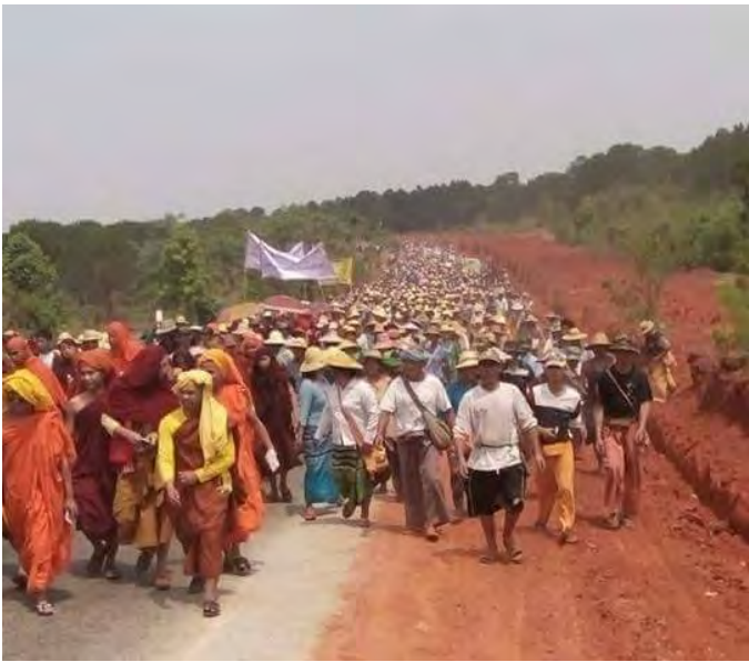
ပင်လုတ်.ဂိုခင်း,ခခေဂင်လုံ သင်ခး,ငလးဂူခင်းမိုဝ်းဂိုဝ်

ဝခင်းထိ 11/04/2017 မးဂူခင်းမိုဝ်းမွတ်; 4,000 ပးလိမ် သင်ခး၊ ဖုတ်ခင်းဂိုဝ်,၊ လဝ်းခးတီး; ခင်းပိုခင်.တီး၊ လုင်း လံးလုင် ဖုတ်ခင်းဂူခင်းမိုဝ်း ငဝ်းငုခင်းတီး,မူဝ်,ခရေ,လီ, လိုဝ်.ခိုဝ်းတီး/ပးတီး,ရှင်သိုဝ် (လခင်း.ငလးဝင်း)၊ ဂူခင်းခုမ်, ယင်းလံးခပ်လိုဝ်းခင်. ခပ်;ရှမ်းခခေဂင်လုံသခင်ခတ်း။ လိုဝ်းခပ်ခွမ်းတုမ် ဂခင်တီးဝတ်./ဂျင်းမူလု,တေျ, ခင်းဝင်း မိုဝ်းဂိုဝ်ကွခင်တင်းသေ ကွခင်ဂခင်သိုပ်,ဂျေ,တီး,ရှေ့ လဝ်း မိုဝ်း ကခင်မီးတင်းရှင်, လွံသိပ်; ဂိုဝ်,ဝခင်းယတ်, ကခင် ယု,ရှိမ်းကွင်းတီးခုတ်ထာခင်,ရှိခင်။ တီးရှေ့လဝ်းမိုဝ်းခခေင်. လိုဝ်းခပ်ကွခင် ဂခင်ဂပ်,ဂိခင်, သခင်ခတ်းလွင်းခွမ်းပခဲနီး ခုတ်ထာခင်, တိုဝ်ခုတ်း၊ ကမ်,ထွမ်,သိင်ဂူခင်းမိုဝ်းကမ်,လံး လုံလွမ်းလိုဝ်း ခခေင်.ယပ်.။ ဝံးပင်ဂပ်,ဂိခင်,ယပ်.