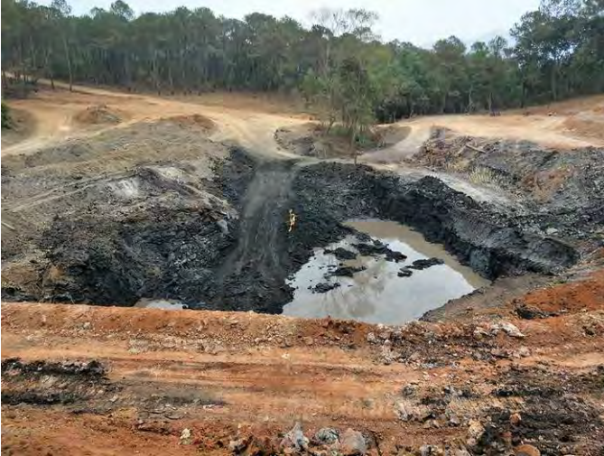
ကွင်းတီးခုတ်ထာမ်ဂိုမ်