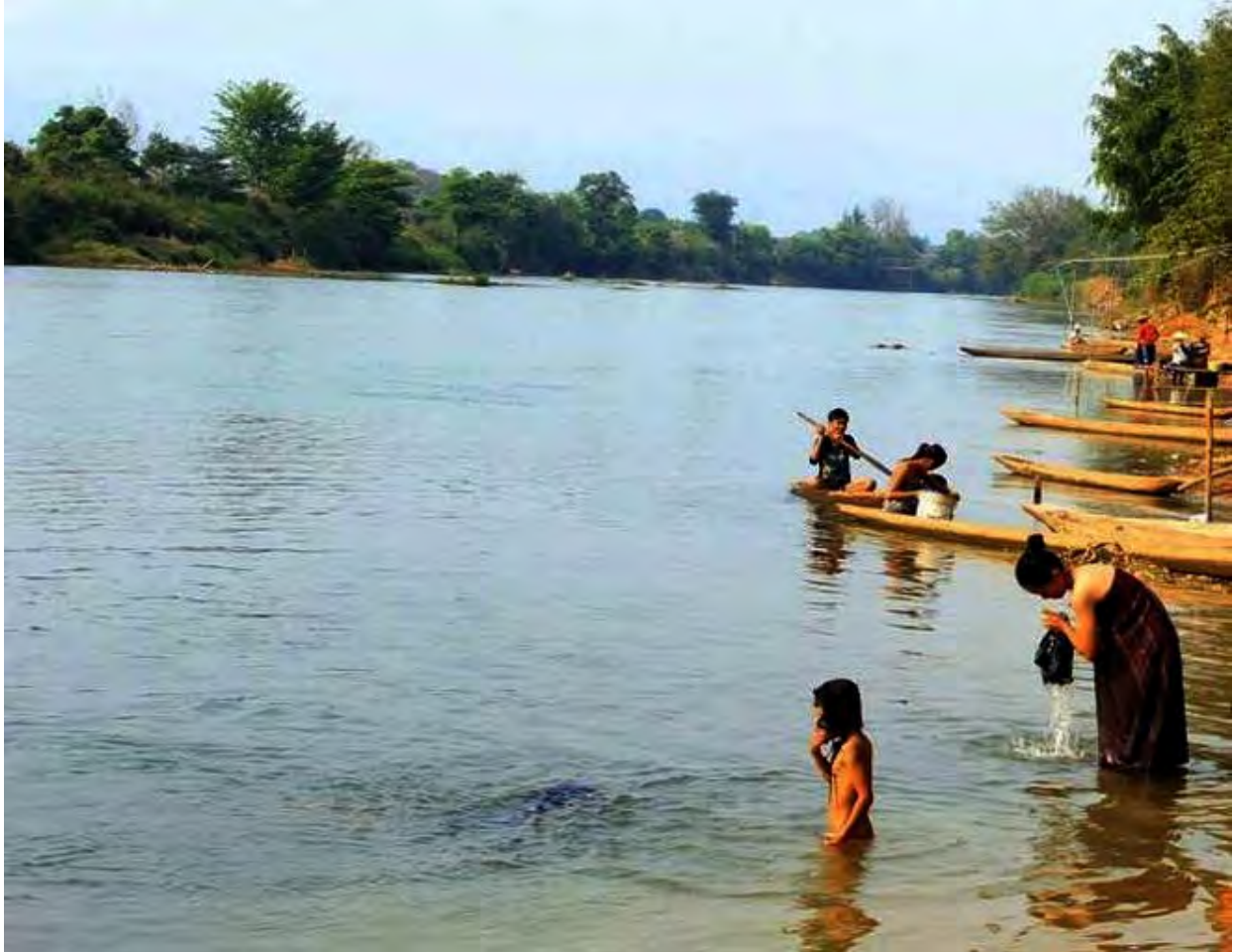
ခေခေ.တိုင်ခေခေလံလတ်းခေခေ, ဝိုင်းလောင်းခိုဝ်း လှိုင်းတံးပွတ်းလခေခေ

ဂူခေခေမိုင်းခင်းပိုခေ.တီးယင်းကွခေခေခေမံးလှိုလွင်းခေခေ.တေကမ်, လိုခေခေသိုယွခေခေ. ခူလှိုလိခေထာခေ, ရှိုခေကေခေတေ ရှိုတ်းရှိုတ်းမီးခေခေတေ, ပုခေခေခေခေ.ခေလ; သတ်းတိုင်, လှိုင်းကေခေပိုင်းခေခေ.တိုင်ခေခေ. ခေခေ.တိုင်, သိုလှိုင်း လံသု, လှိုခေခေ.တိုင်ခေခေ.ယဝ်။ ဂူခေခေမိုင်းခင်းပိုခေ.တီးပိုင်းကိုင်ခေခေ.ခေ.သေရှိုဂြိုခေပုခေခေမခေခေမးယူ,။