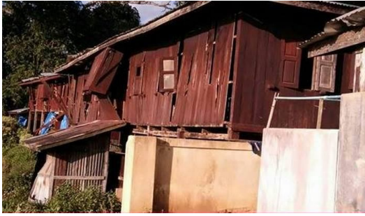
အစိုးရတပ်မတော်မှ လေယာဉ်ဖြင့်ဗုံးပစ်လွှတ်ရာ ပန်မတ်မီးဘုန်းကြီးကျောင်းကို ကိုထိခိုက်ပျက်ဆီးသွားပုံ