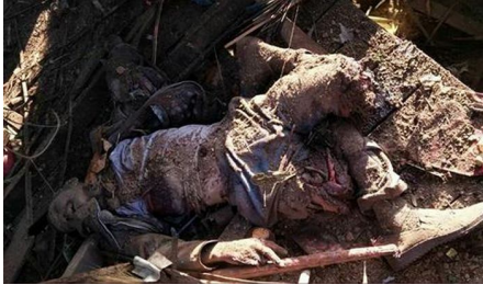
လင်းစိတ္တ၏ အလောင်း၊ အစိုးရတပ်မတော်မှ လေယာဉ်ဖြင့် ပုံးပစ်လွှတ်ရာမှ ထိမိသေဆုံး