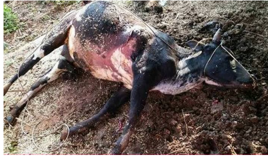
လင်းစိတ္တ၏ နွား၊ အစိုးရတပ်မတော်မှ လေယာဉ်ဖြင့် ဗုံးပစ်လွှတ်ရာမှ ထိမိသေဆုံး