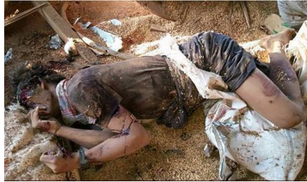
စိုင်းအိုက်ဝန်း၏ ရုပ်အလောင်း၊ အစိုးရတပ်မတော်မှ လေယာဉ်ဖြင့် ပုံးပစ်လွှတ်ရာမှ ထိမိသေဆုံး