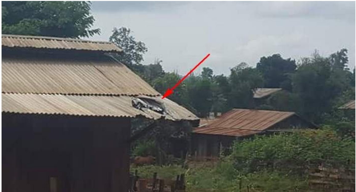
မာဂ်,လူင်သိုဂ်းမာခဲးတိုဝ်းလုးဂျီခဲးဂုခဲးဝါခဲး ခဲးဝါခဲးပာင်ပွဲး