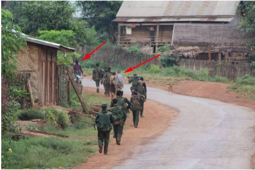
သိုဂ်းမာခင်းတီးလုံ.ဂူခင်းဝါခင်းပီလွမ်,လွမ်းထီဝ်သိုဂ်းခဝ် တျ,ငဂ့.ဂင်းခေတူဝ် ဂွပ်းရှိုဝ်လျးယိုဝ်း

ရှိုင်းတိုတ်းယျး မူခင်.ခမးတူဝ်လုံတီးပာင်ပွဲခမ်. ကိုင်ခိုင်ဂူခင်းမိုင်းတုဂ်းယွခင်း ယွခင်.ဝျး ယျး မဝ်းဂမ် လးဂူခင်း တိတ်းလပ်း မခင်းခမ် ခိုခင်း ခင်းပိုခင်.တီးမိုင်းဂိုင် လးခမ်.လခင်း သေ ခွင်,သီ,ကပ်ခိုခင်းလိုင်;တံး/ တပ်.သိုဂ်း လိုင်;တံး RCSS/SSA လံးရှမ်းဂခင်တင်းဂူခင်း မိုင်းခတ,တင်းမး။ ယျမ ခင်းပိုခင်.တီးခမ်. ထုဂ်, ဂေးထုဂ်,သေ ရှာသိုဝ်.ငါး၊ လုဂ်းကွခင်, ကျယု 10 ခုပ်,ဂေးယင်းဂါခင်လုံ.တိုဝ်းပျး။ ယျမ ခိုင်;မိတ်.လုံလံးသိုဝ်. 150 ဂျပ်း။ ဂူခင်းလိုင်; တိတ်းလပ်းယျးမဝ်းဂမ် ခခင်.လံး တိလွပ်းဂုမ်း ခင်ဝံ.တီးရှိုင်းတိုတ်းယျး ပိုဝ်း တျ, မူခင်.ခမးတူဝ်လုံ တျးခါဝ်းတၢင်း 5-6 လိုခင်း။