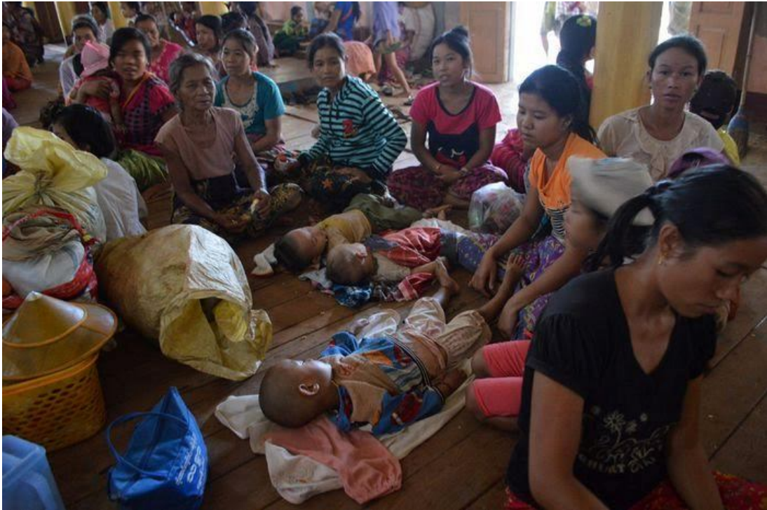
စစ်ဘေးရှောင်များတုံလောဘုန်းကြီးကျောင်းတွင် နိုလှုံနေပုံ