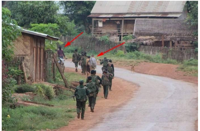
တိုက်ပွဲအတွင်း အစိုးရတပ်မတော်မှ ပြည်သူများကို ကြားညှပ်ခေါ်ဆောင် သွားနေပုံ

ပန်ပိုင်းရွာတွင်းရှိ မူးယစ်ဆေးဝါး တိုက်ဖျက်ရေးစင်တာသည် RCSS/SSA ထံမှ ဒေသခံပြည်သူလူထုများ၏ တောင်းဆိုချက်အရ ဖွင့်လှစ်ခဲ့သည်။ ဤသို့တောင်းဆိုခြင်းမှာ မိုင်းကိုင်မြို့နယ် နှင့် နမ့်လန်မြို့နယ်တွင်းရှိ ဆေးသုံးစွဲမှုတစ်နှစ်ထက်တစ်နှစ်ပိုမိုများပြား လာသောကြောင့် တောင်းဆိုခြင်းဖြစ်သည်။