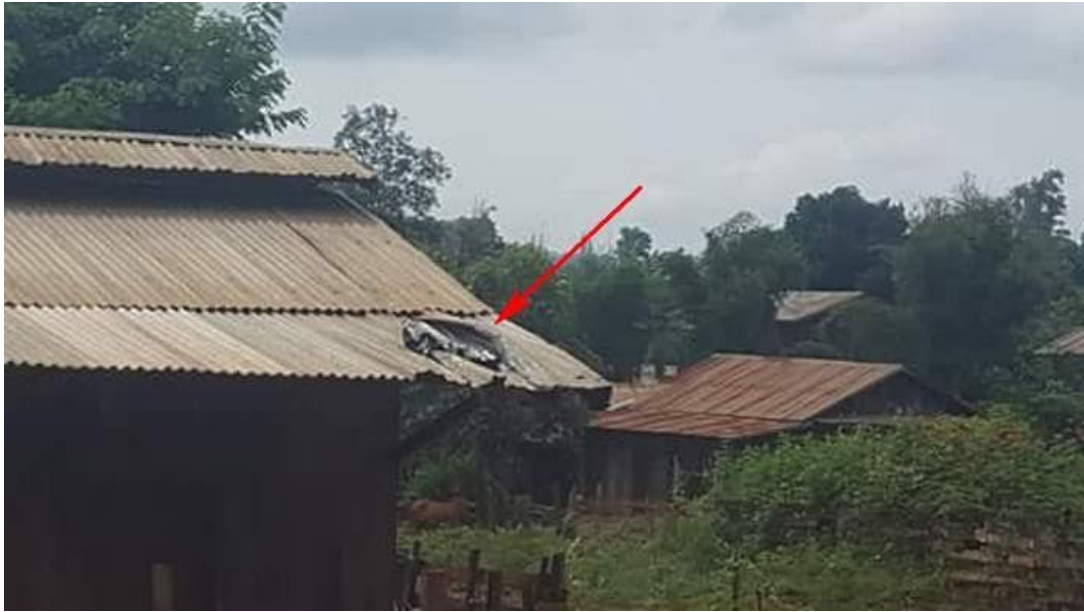
အစိုးရတပ်မတော် ၏ မော်တာ ပစ်ခတ်ကြောင့် ပန်ပိုင်းရွာထဲရှိ လူနေအိမ်ထိခိုက်သွားပုံ