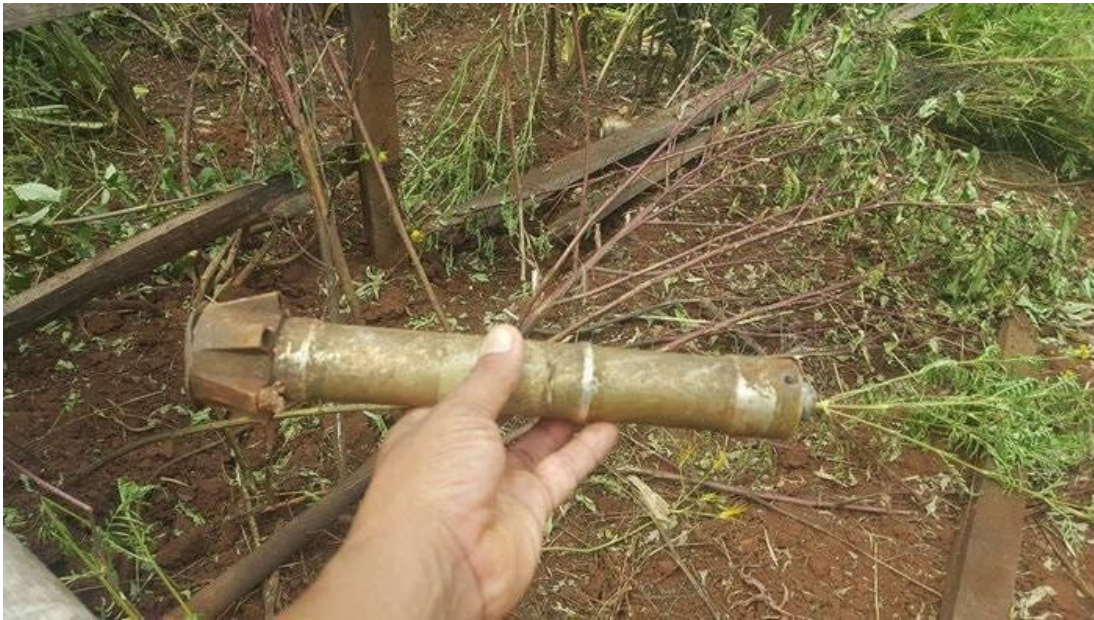
ပန်ပွိုင်းကျေးရွာတွင် အစိုးရတပ်မတော်မှ လူနေအိမ်ရှိရာရွာထဲသို့ပစ်လိုက်သည့် မော်တာ ဗုံး